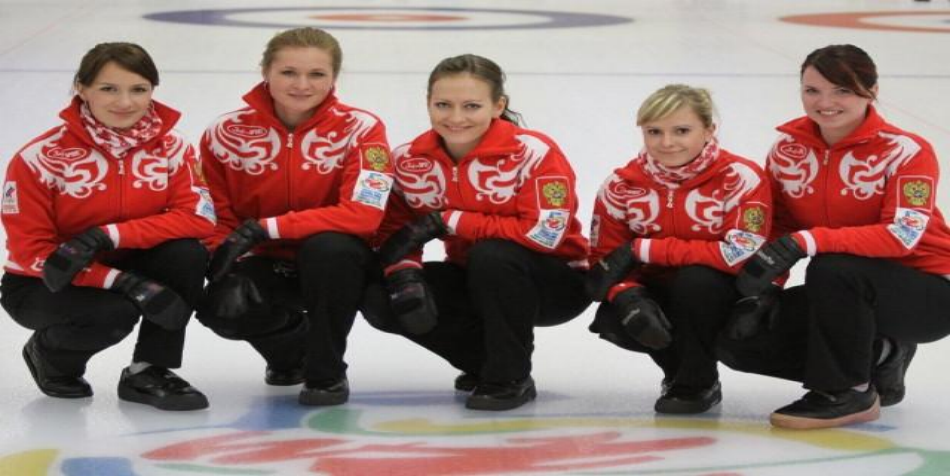
Сборная России по керлингу