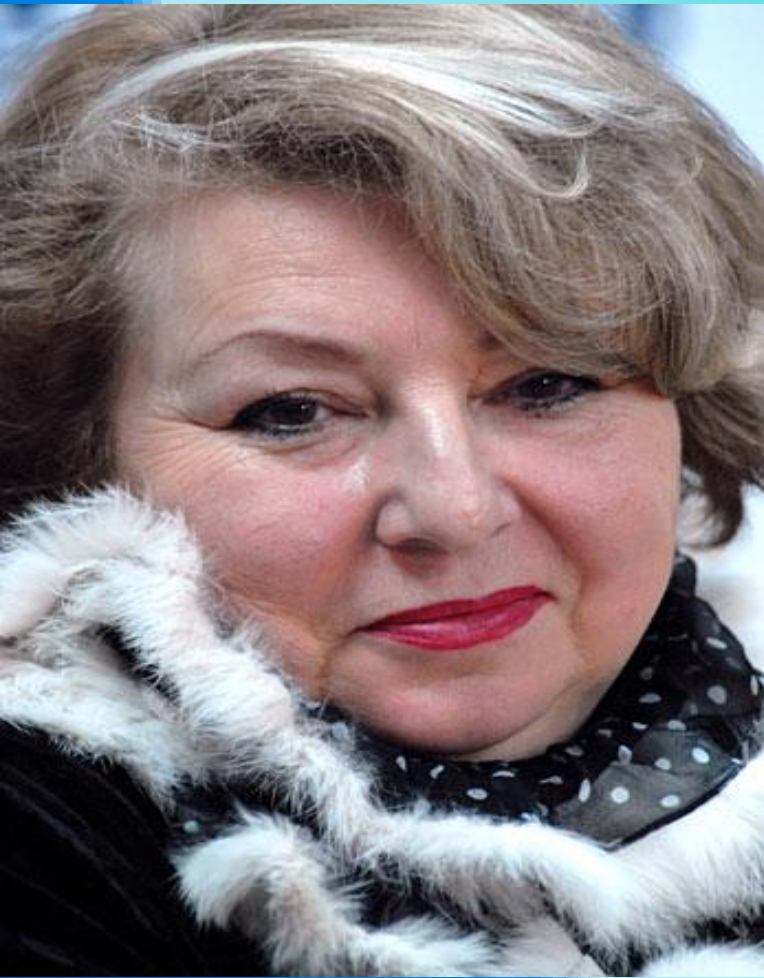
Тарасова Татьяна Анатольевна