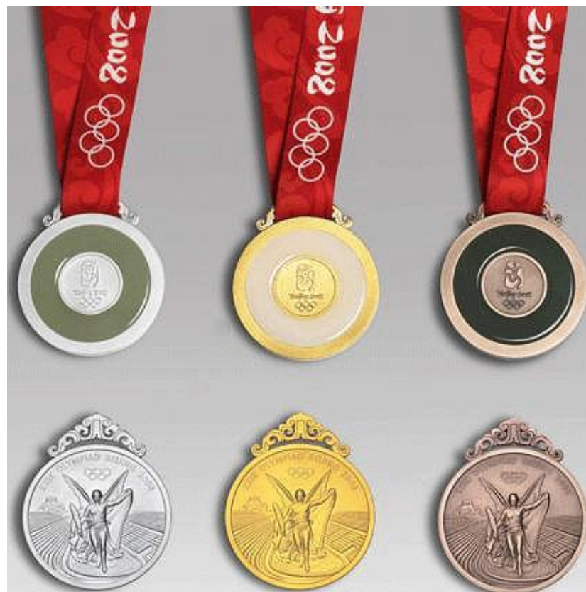
Медали Олимпийских игр 2008 в Пекине

Это знак отличия за личное или командные спортивные достижения в соревнованиях на Олимпийских играх, также считается атрибутикой, используемой Международным олимпийским комитетом для продвижения идеи Олимпийского движения во всём мире. Олимпийские медали — золотую, серебряную и бронзовую — вручают трём спортсменам, показавшим наилучшие результаты в соревновании.