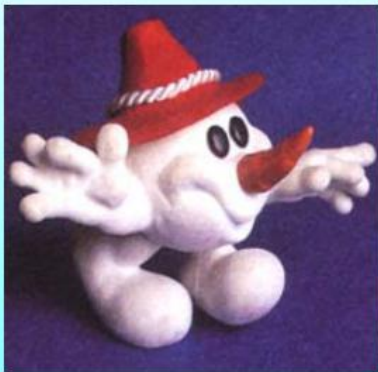
Снеговик Олимпиямандл (Olympiamandl)