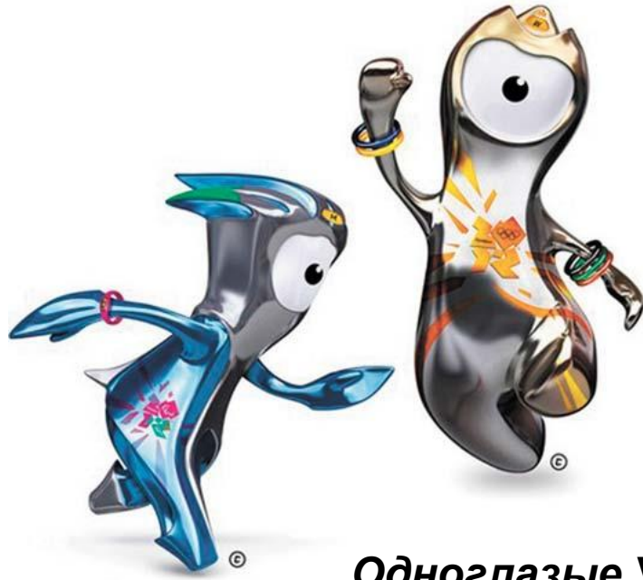
Одноглазые Уэнлок и Мендвилль