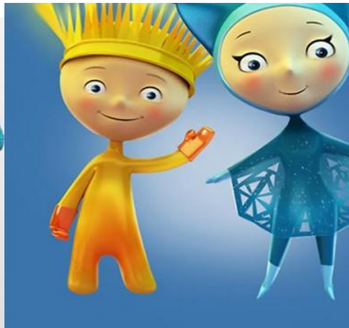
Лучик и Снежинка

Талисманы Олимпиады в Сочи 2014 года: Леопард, Зайка и Белый Мишка, а также талисманы параолимпиады - Лучик и Снежинка.