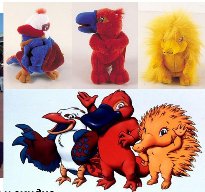
Кукабурра Олли, утконос Сид и ехидна Милли

Птичка кукабара Олли, утконос Сид и ехидна Милли – животные, которые водятся только в Австралии и символизируют собой три стихии: воздух, землю и огонь.