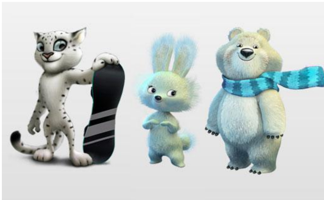
Леопард, Зайка и Белый Мишка