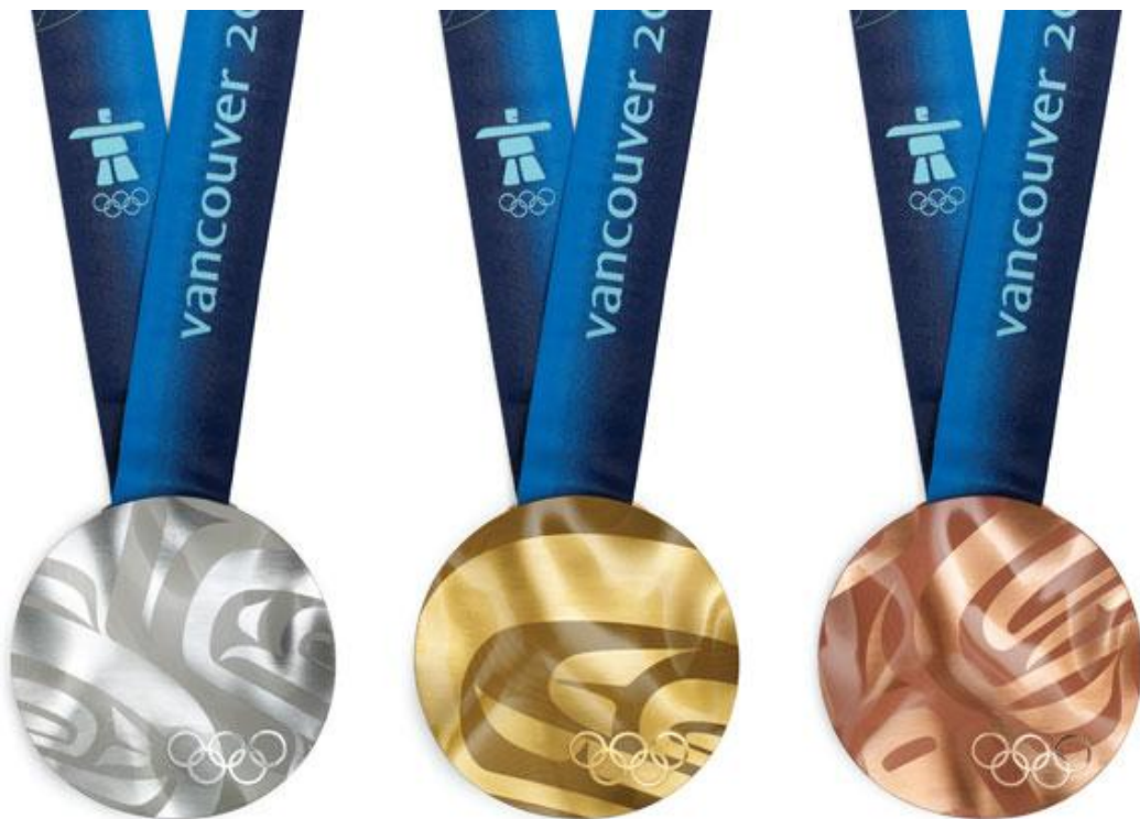
Медали Олимпийских игр в Сочи 2014