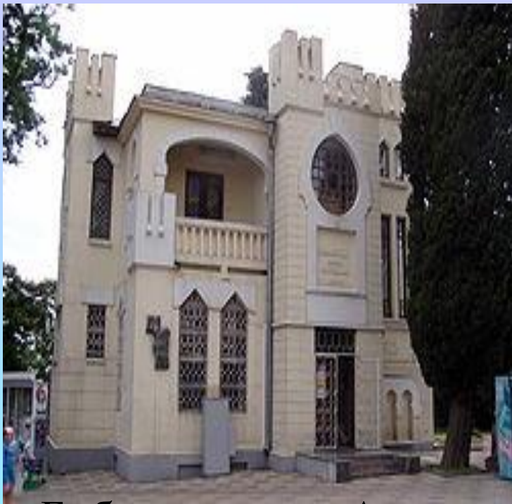
Библиотека им. А. С. Пушкина