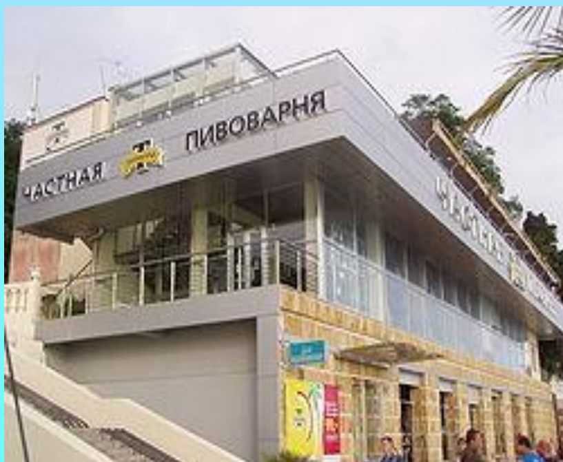
Ресторан на набережной