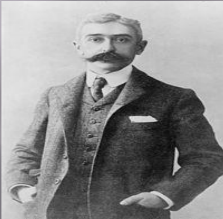
Пьер де Кубертен