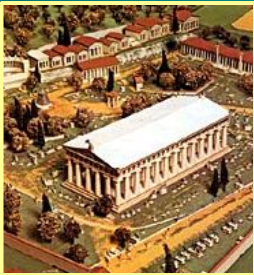
Храм Зевса в Олимпии

По мифологическому преданию, Олимпийским играм предшествовали погребальные игры в честь героя Пелопса , впоследствии возобновленные Гераклом. Пелопс и Геракл считались также учредителями первых видов состязаний: скачек на колесницах, бега и борьбы. В 4 в. до н. э. на основании реконструкции списков победителей была условно определена дата первых Игр — 776 до н. э. Установление порядка их проведения приписывалось в древности царю Элиды Ифиту, спартанскому законодателю Ликургу и ахейцу из Писы Клеосфену, заключившим (с одобрения дельфийского оракула) священный союз. Текст договора о правилах состязания был записан на бронзовом диске, о нем в 4 веке до н. э. сообщает Аристотель, во в 2 веке в храме Геры его еще видел Павсаний .