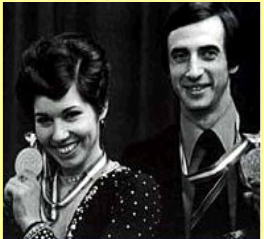
Людмила Пахомова и Александр Горшков — первые олимпийские чемпионы в спортивных танцах на льду. Калгари. (1988).