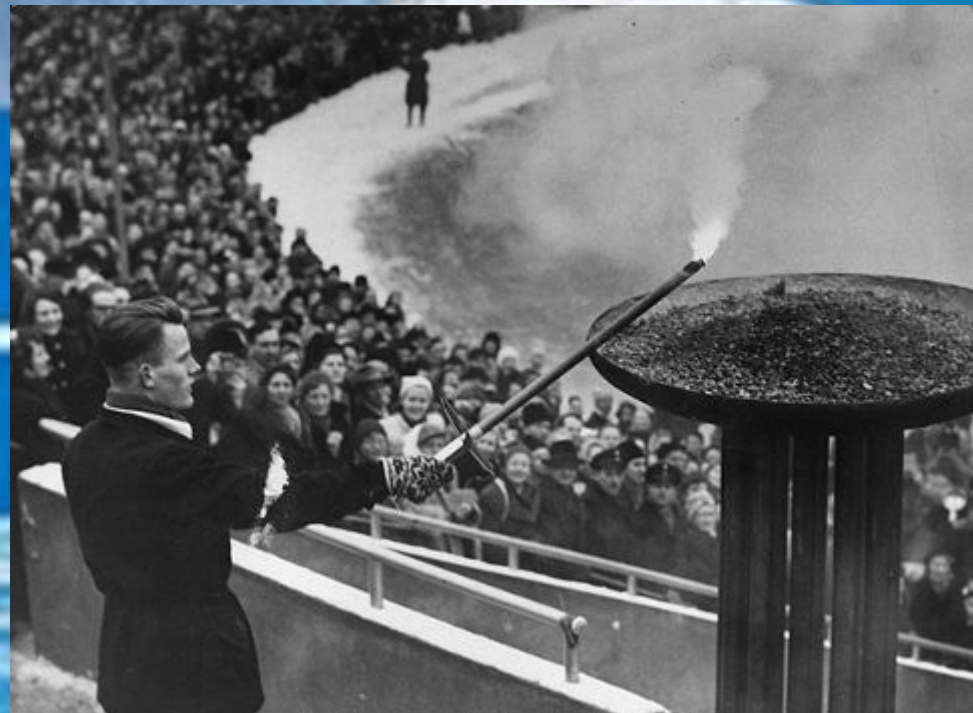
Зажжение олимпийского огня в Осло

VI зимние Олимпийские игры в норвежском Осло стали «авторами» многочисленных новшеств – впервые олимпийский факел путешествовал по всей стране, впервые Игры открыла женщина (наследная принцесса Норвегии Рагнхилд объявила об открытии VI зимних Олимпийских игр), впервые они прошли не в курортном городке, а в столице государства.