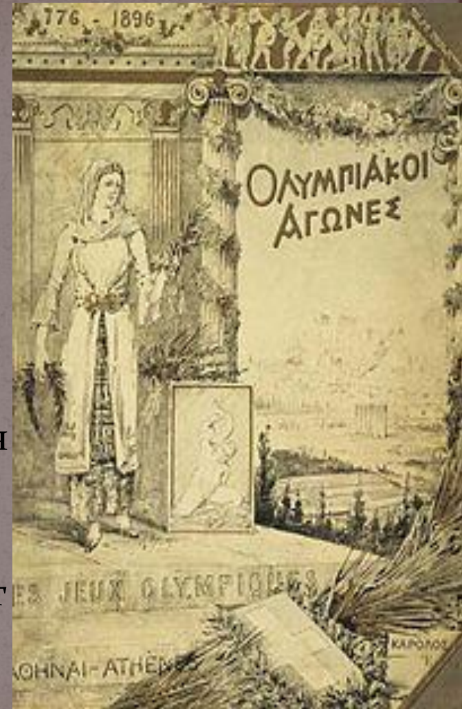
Плакат первых Олимпийских игр