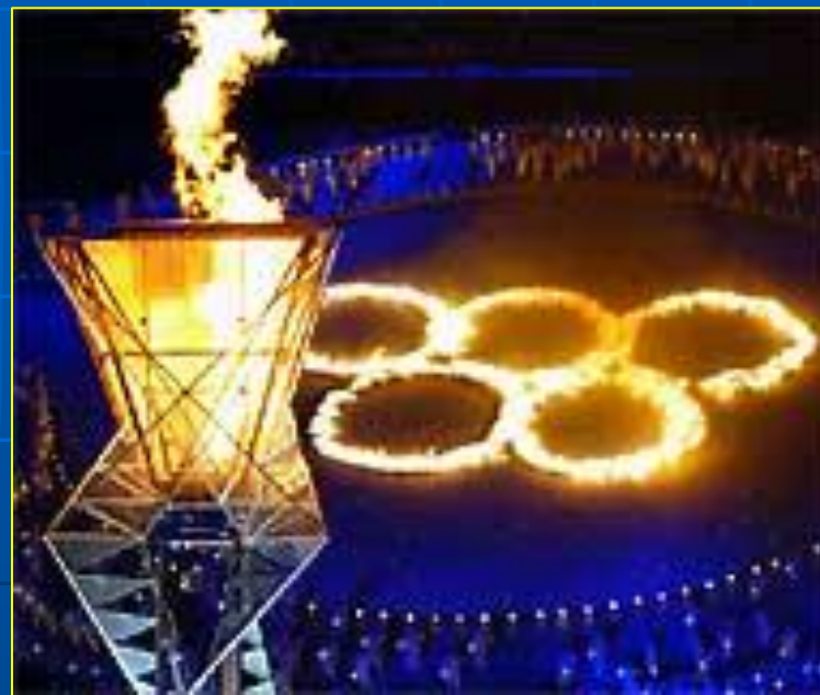
Афины, 2004 год

Ритуал зажжения священного огня происходит от древних греков и был возобновлен Кубертенем в 1912 году. Факел зажигают в Олимпии направленным пучком солнечных лучей, образованных вогнутым зеркалом. Олимпийский огонь символизирует чистоту, попытку совершенствования и борьбу за победу, а также мир и дружбу. Традиция зажигать огонь на стадионах была начата в 1928 году (на зимних Играх – в 1952 году). Эстафета по доставке факела в город-хозяин Игр впервые состоялась в 1936 году.