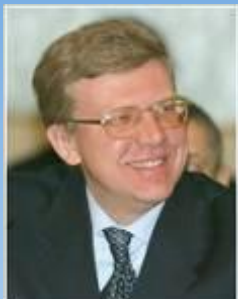
Кудрин Алексей Заместитель председателя