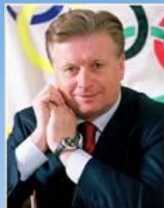
Тягачев Леонид Президент Олимпийского комитета России