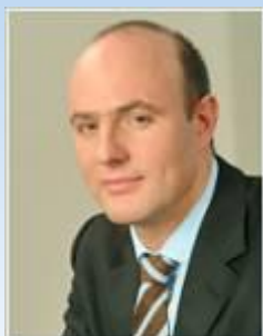
Чернышенко Дмитрий Генеральный директор