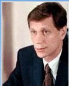
Жуков Александр Председатель

Сочи на проведение зимней Олимпиады 2014