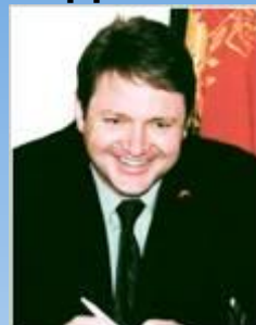
Ткачев Александр Губернатор Краснодарского края