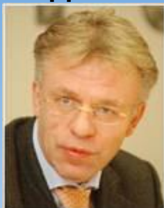
Фетисов Вячеслав Руководитель Федерального агентства по физической культуре и спорту