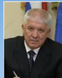
Колодяжный Виктор Глава города Сочи

Руководители Заявочного комитета «Сочи-2014»