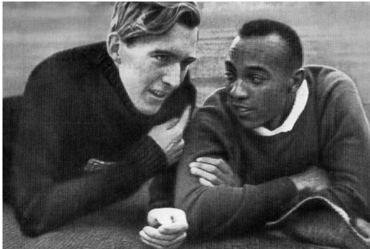
Лутц Лонг и Джесси Оуэнс