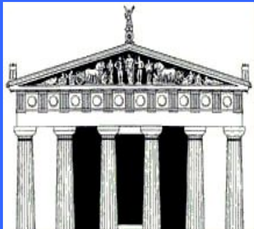
Храм Зевса в Олимпии

античности справлялись в честь Зевса Олимпийского через каждые четыре года, летом, в Элиде (области на северо-западе Пелопоннеса) в Священном городе Олимпии у подножия горы Олимп.