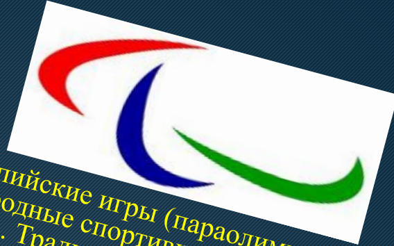
Эмблема паралимпийских игр

Паралимпийские игры (параолимпийские игры) — международные спортивные соревнования для инвалидов. Традиционно проводятся после главных Олимпийских игр, а начиная с 1992 — в тех же городах; в 2001 эта практика закреплена соглашением между МОК и Международным паралимпийским комитетом (МПК). Летние паралимпийские игры проводятся с 1960, а зимние паралимпийские игры — с 1976.