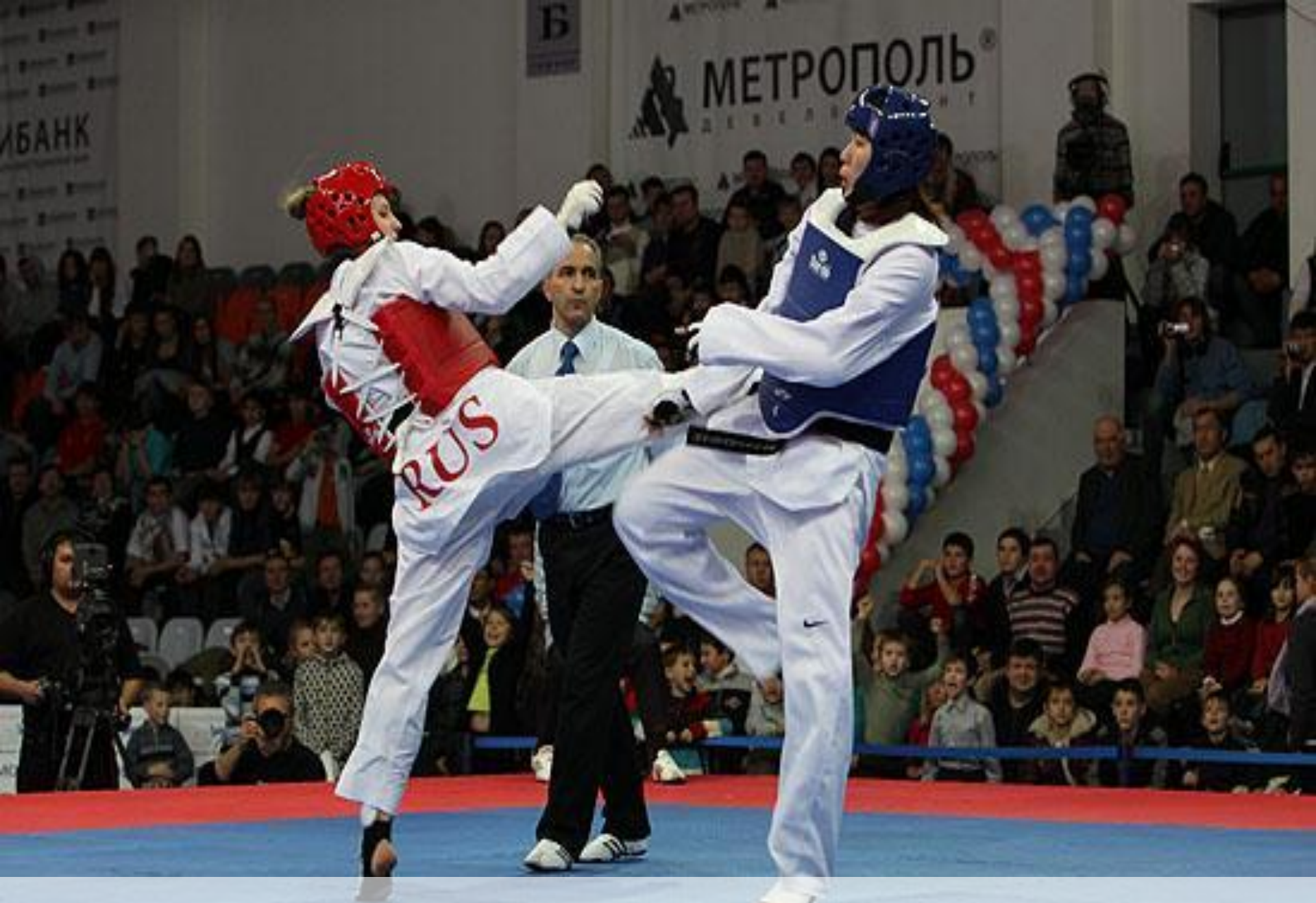
Тхэквондо, женщины (4)