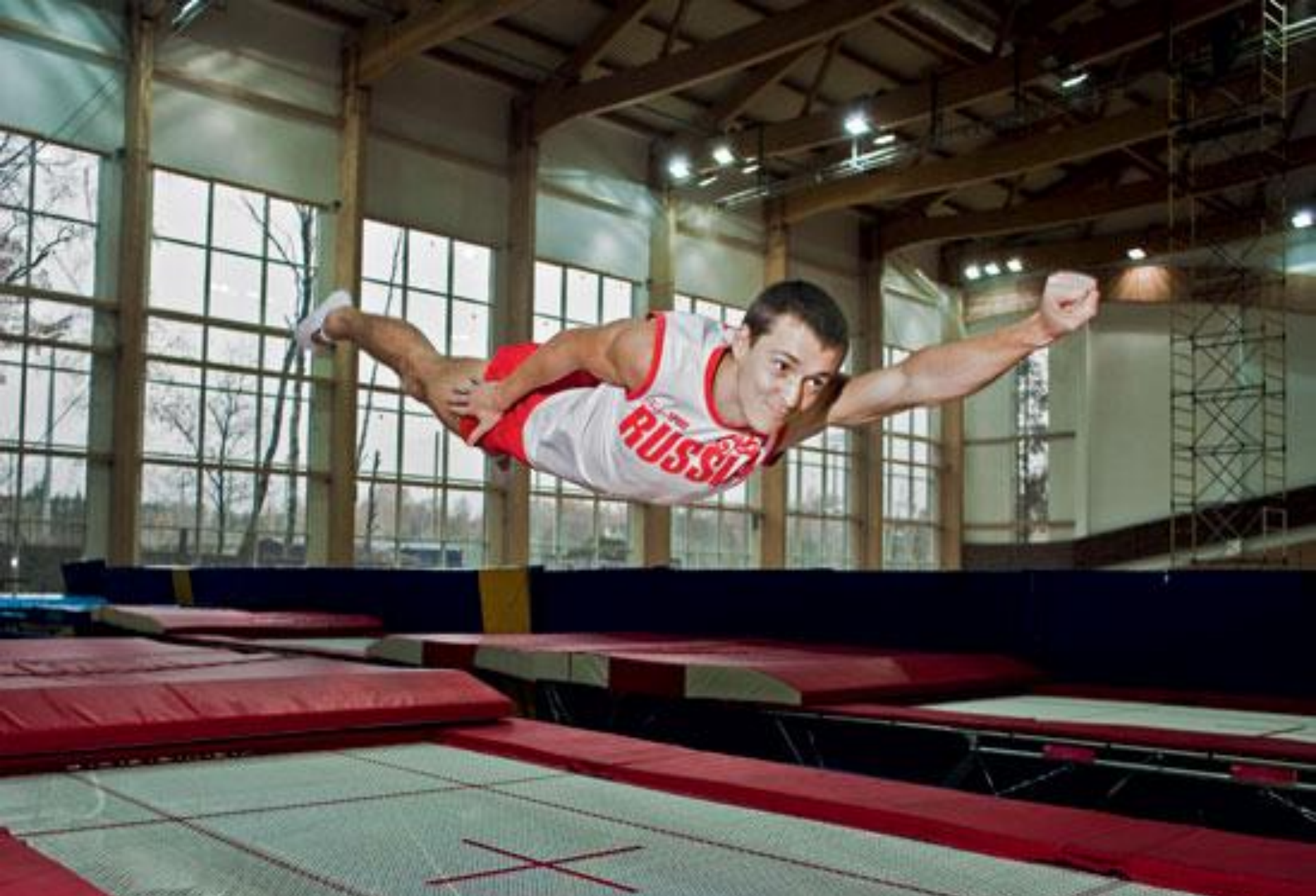
Прыжки на батуте (2)