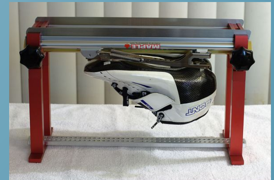
Станок для заточки беговых коньков