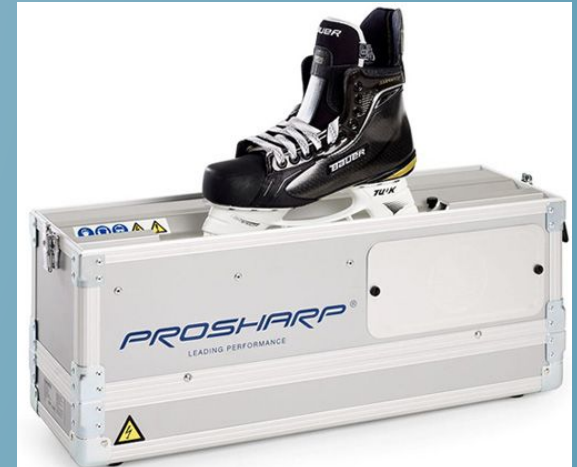
Станок для заточки фигурных и Хоккейных коньков