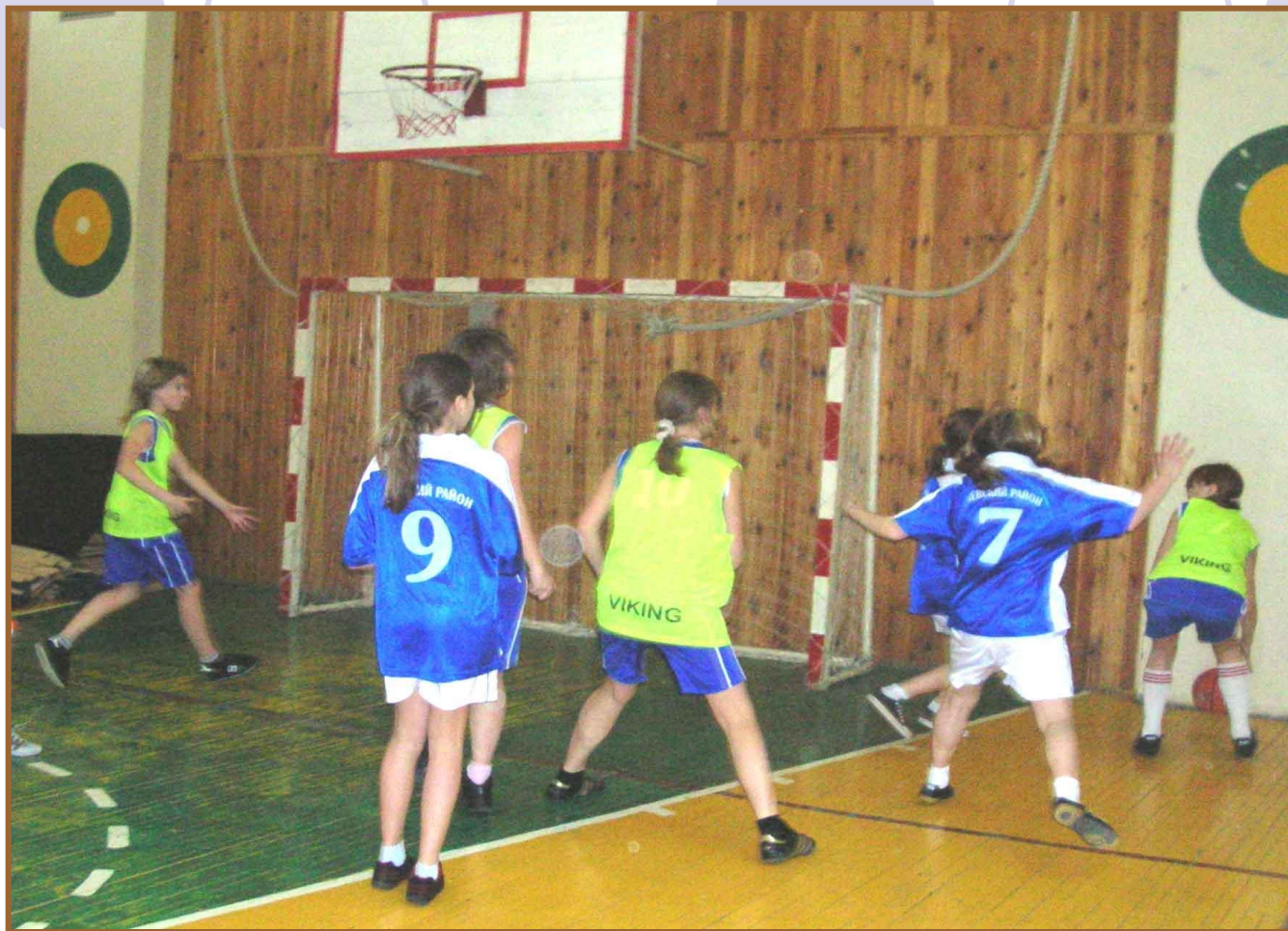
Игра с 458 школой