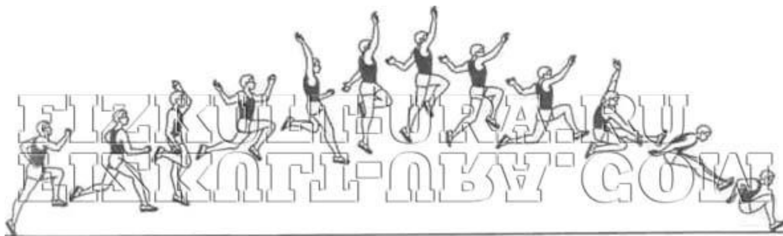
Прыжок в длину с разбега способом «ножницы»