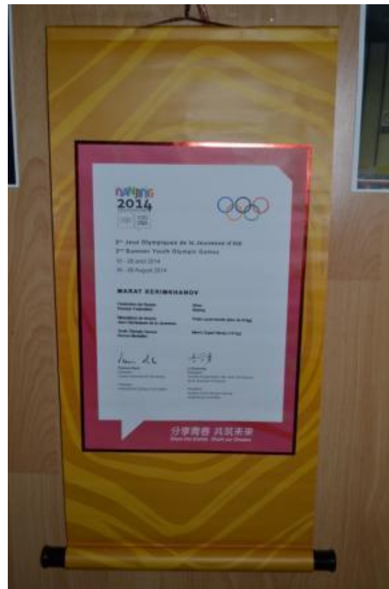
ГРАМОТА БРОНЗОВОГО ПРИЗЕРА КЕРИМХАНОВА МАРАТА