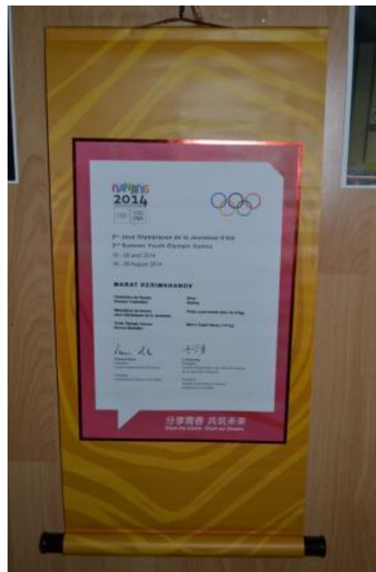
ГРАМОТА БРОНЗОВОГО ПРИЗЕРА КЕРИМХАНОВА МАРАТА