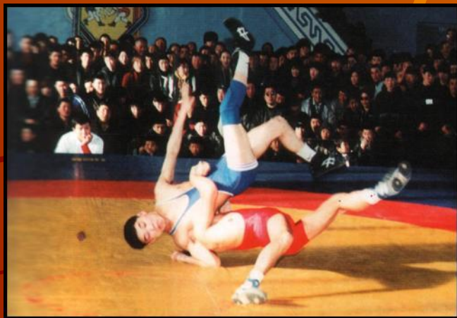
бухэ барилдаан (борьба)