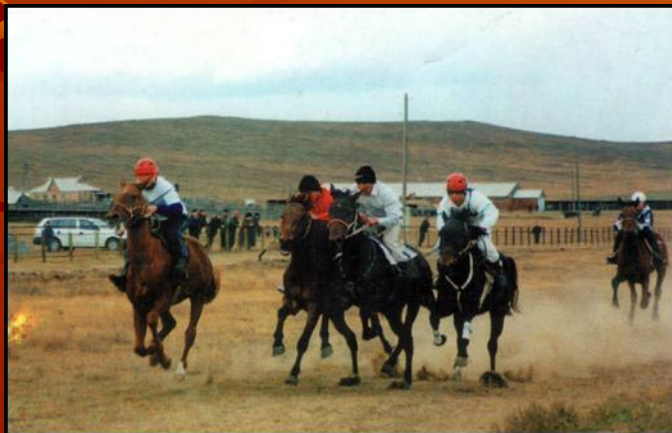
мори урилдаан (конные скачки)