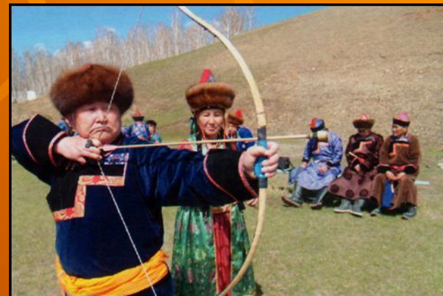
hur харбаан (стрельба из лука)