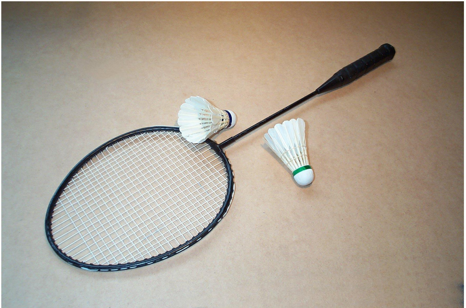
Воланы и ракетка для бадминтона