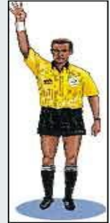
Відлік 4 сек