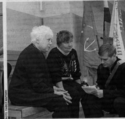
Матери всегда живут надеждой