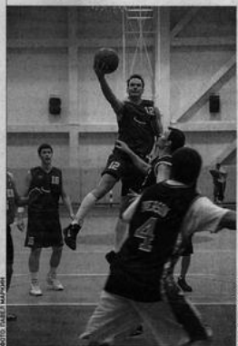
В ИГРЕ ФИНАЛИСТЫ: литовская команда атакует (слева), баскетболисты Лиги журналистов защищаются