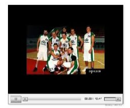
Фоторепортаж с «КУБОКА НАДЕЖДЫ - 2007».

Тринадцатый – счастливейший Несмотря на повсеместное убеждение, что 13 – число несчастливое организаторы «КУБОКА НАДЕЖДЫ» отказались от идеи проведения очередного состязания мастеров пера и микрофона отказаться не могли. С 95 года десятки журналистов принимают участие в этой акции корпоративной солидарности. Мало кто мог тогда предположить, что идея зарабатывать средства семьям пропавших без вести и погибших журналистов с помощью баскетбола в исполнении любителей проживет 13 лет. Однако, 15 декабря сего года «КУБОК НАДЕЖДЫ» не только состоялся уже в 13 раз, но и вошел в его историю несколькими очень существенными новшествами. Во-первых перед турниром состоялась встреча участников, организаторов, сочувствующих и соперничающих.