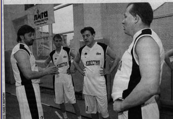
Команда «Известий»: МИНУТА НА РАЗМЫШЛЕНИЕ

Нынешний турнир проходил под девизом «Мы помним».