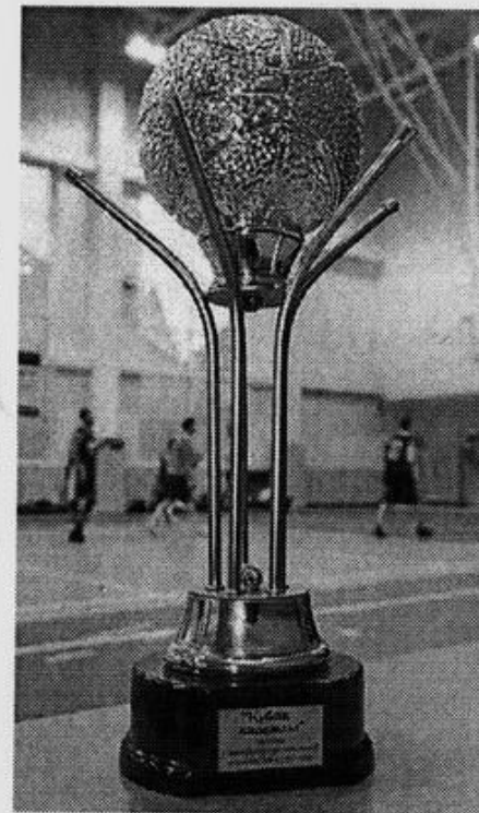
«Кубок Надежды» разыграли уже в тринадцатый раз

Естественно, что главное на таких мероприятиях не спортивная составляющая, а возможность пообщаться в тесном кругу. Не исключено, что весной подобный турнир пройдет уже в Литве. С такой идеей выступили прибалты, которые остались в восторге от визита в Петербург.