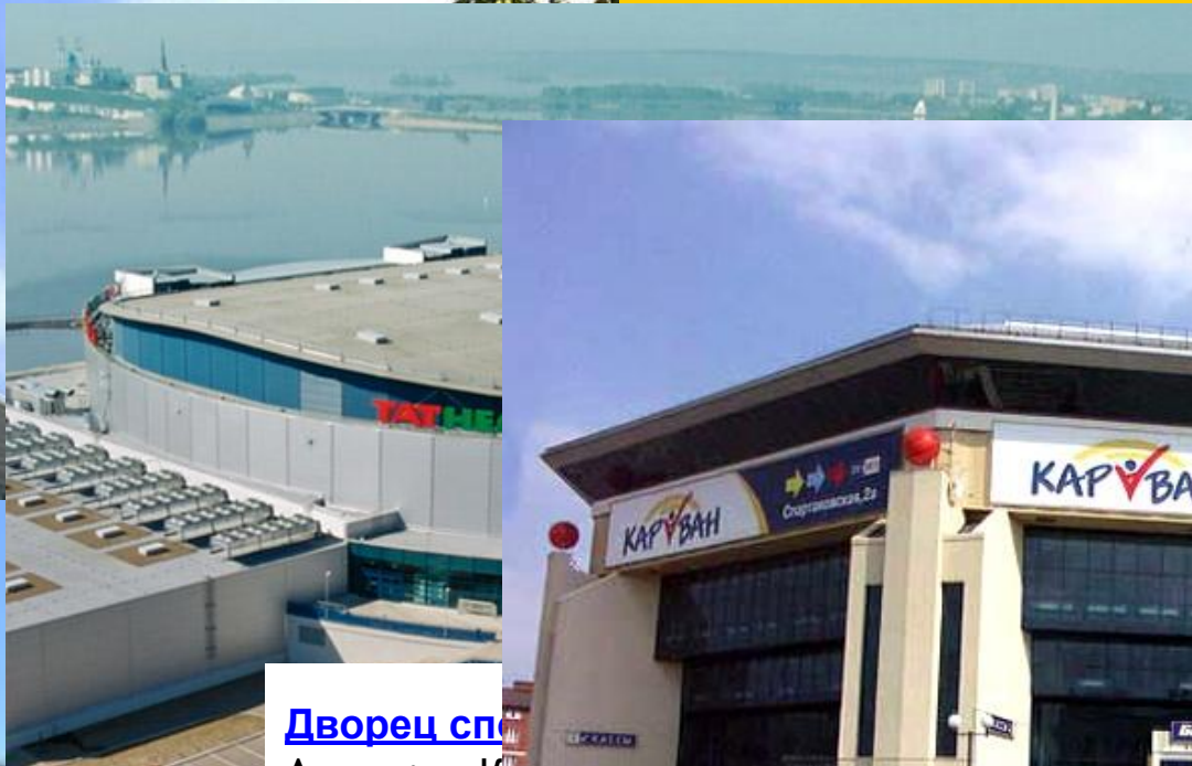
Дворец спорта Адрес: г. Казань