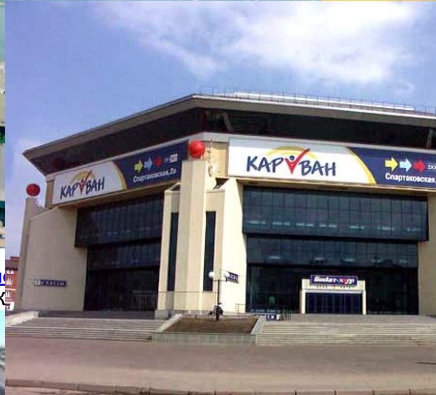
Баскетбольное спортивное сооружение «Баскет-Холл» Адрес: РФ, РТ 420111, г. Казань, Спартаковская, 1