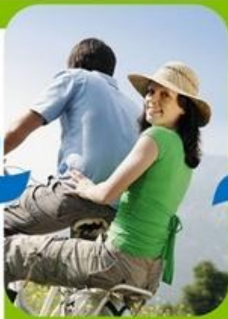
Активный образ жизни