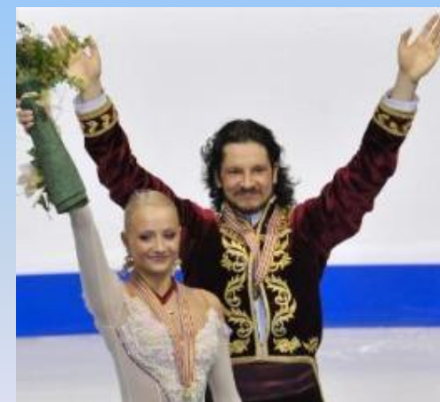
Оксана Домнина и Максим Шабалин