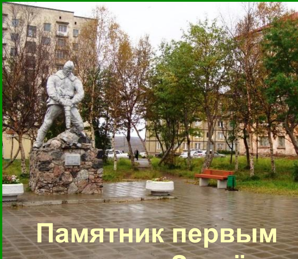
Памятник первым строителям Заозёрска