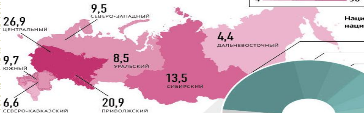
Национальный состав (среди указавших национальную принадлежность), %