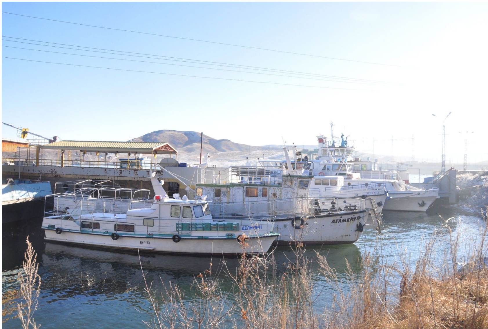
Современные речные суда