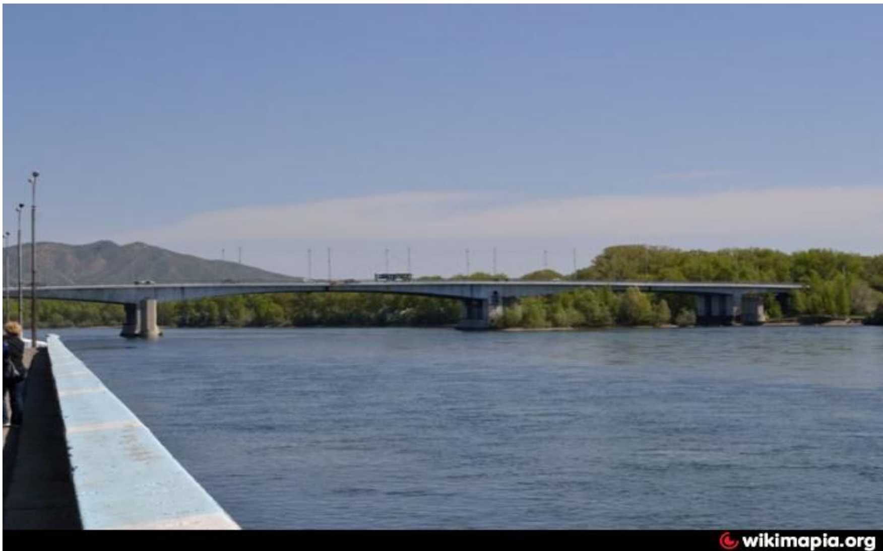
Иртышский мост в городе Усть-Каменогорск