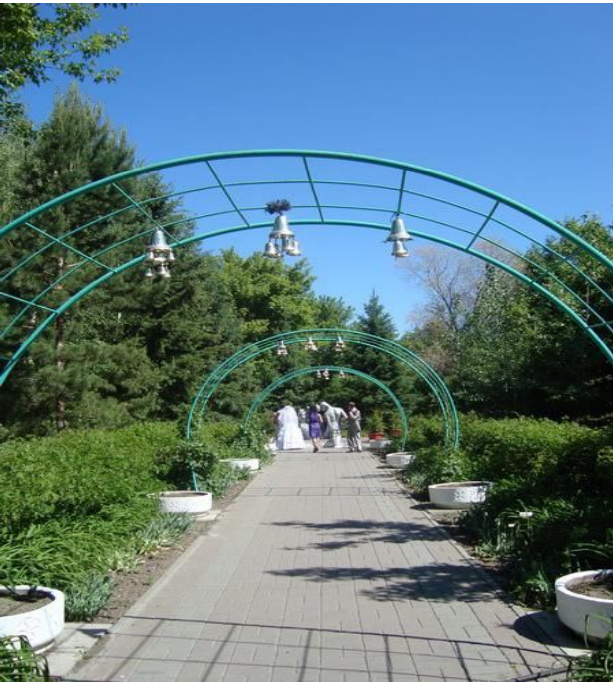
Парк Жастар (им. Кирова) в городе Усть- Каменогорск