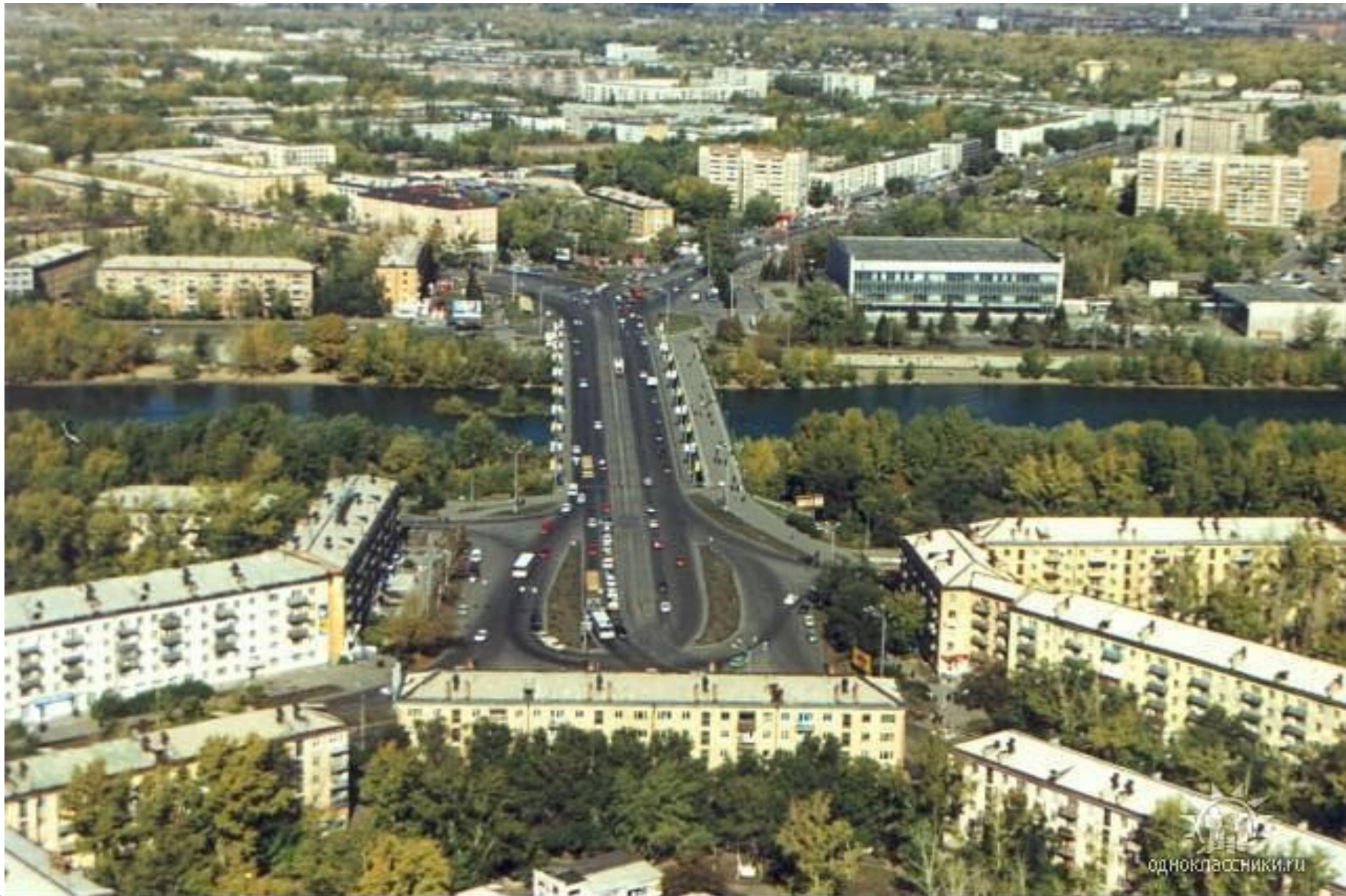
Ульбинский Мост в городе Усть-Каменогорск