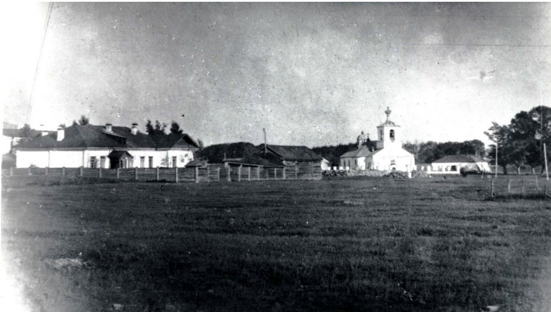
Усть-Каменогорская крепость, основанная майором Иваном Лихаревым. С нее начинался город.