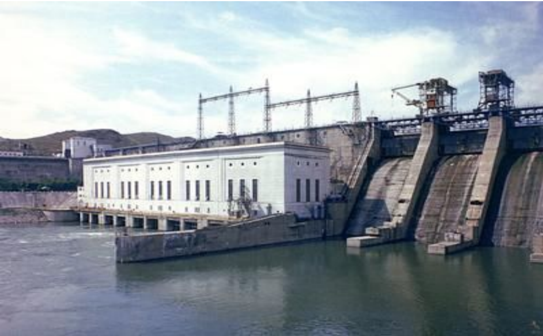
Усть-Каменогорская ГЭС в городе Усть-Каменогорск