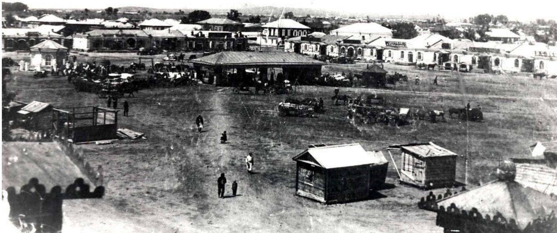
Вид на Базарную площадь с Народного дома (ныне драмтеатр им. Жамбыла)