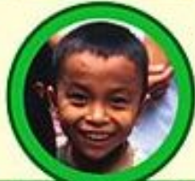
Представитель монголоидной расы