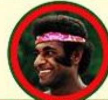
Представитель австралоидной расы