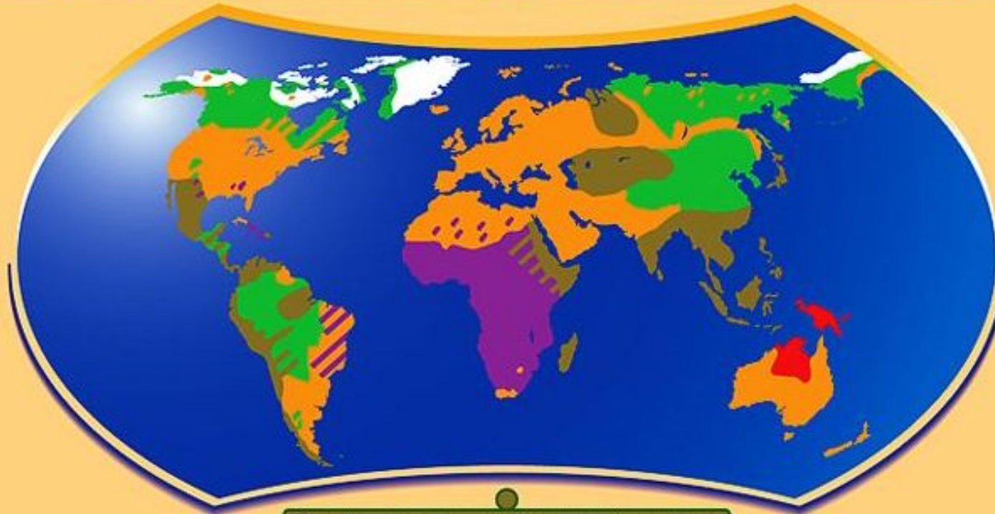
Переходные типы между основными расами