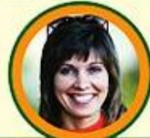
Представитель европеоидной расы