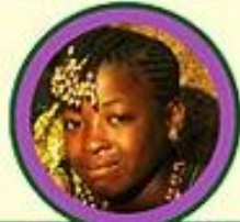
Представитель негроидной расы