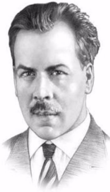
ВАВИЛОВ Николай Иванович 1887-1943