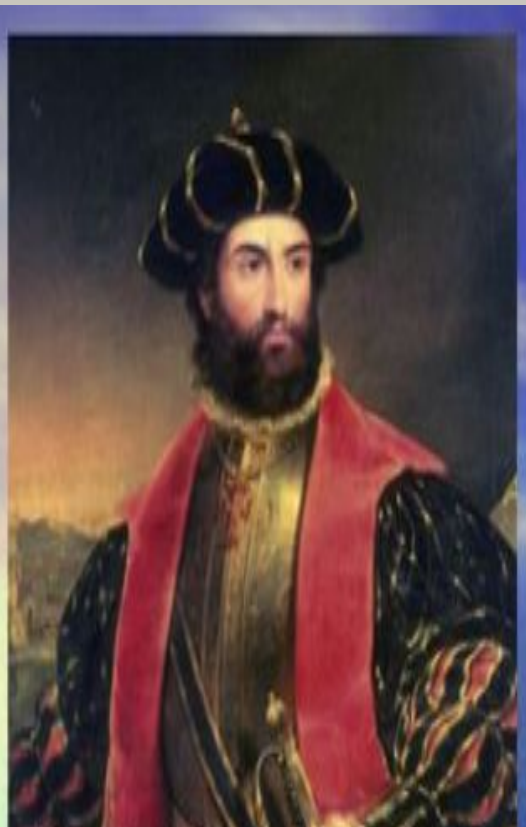
Васко да Гама (1469-1524)