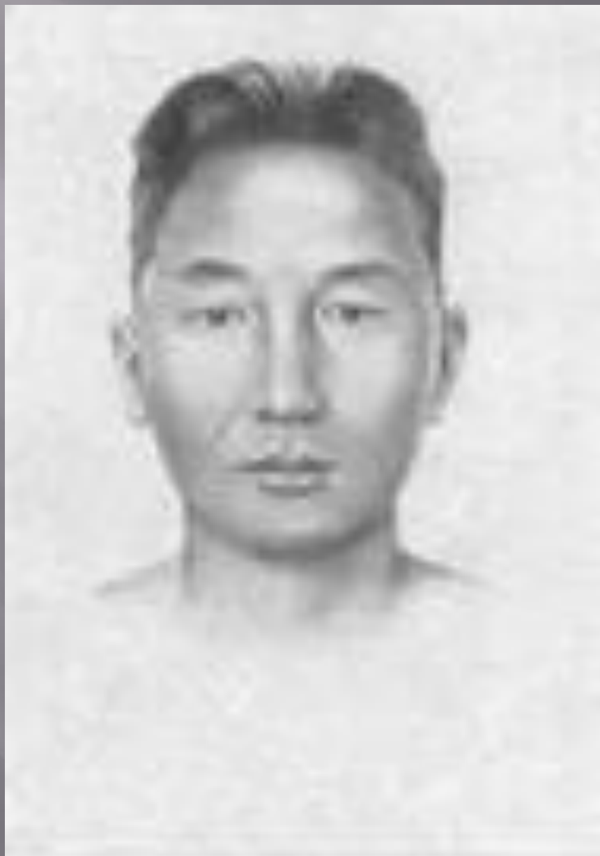
Composite sketch of a man