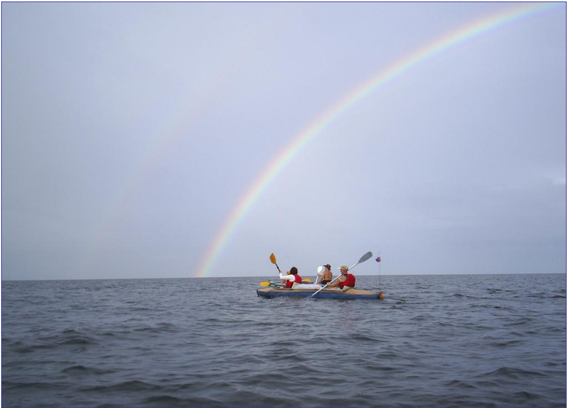
Радуга над Байкалом