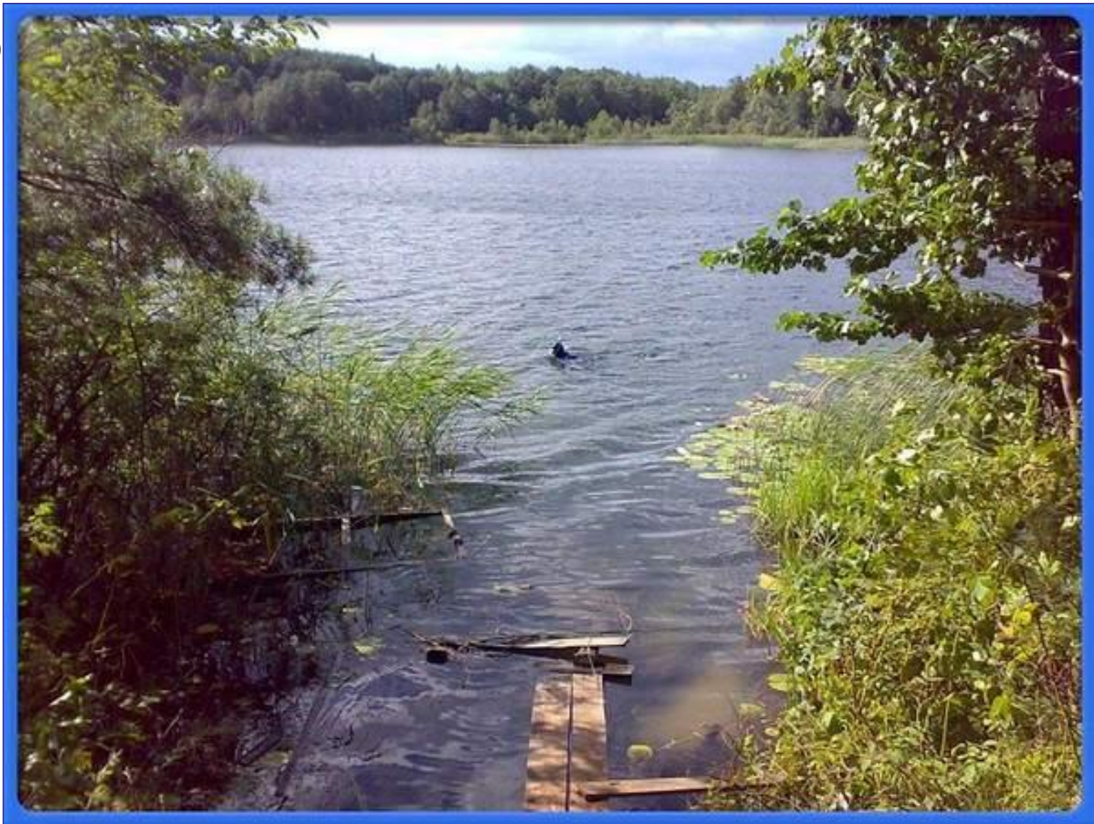
Озеро Табашинское – Зрыв