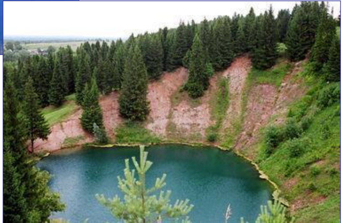
Озеро Морской глаз