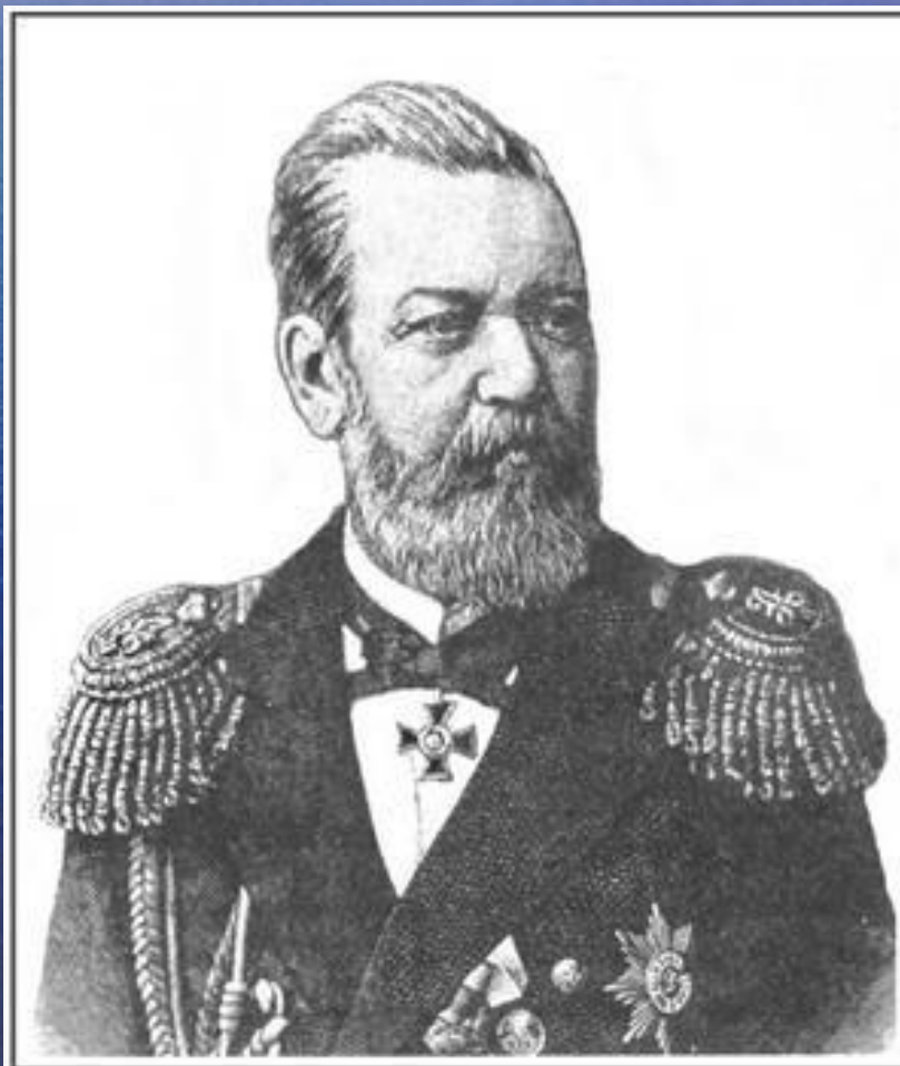
Адмирал И.А. Шестаков