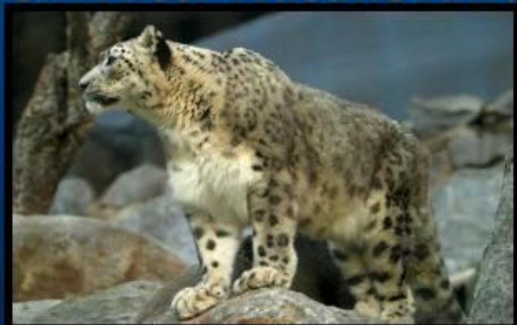
с н е ж н ы й