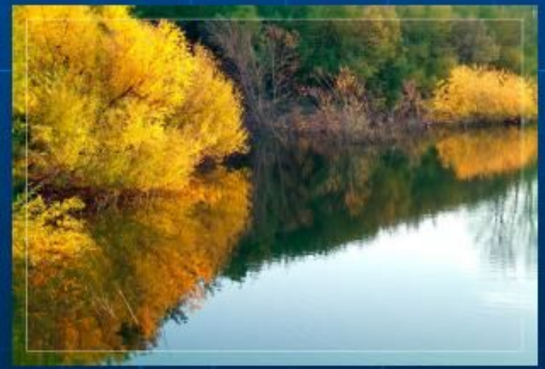
ОСЕНЬ НА РЕКЕ ИШМЕ