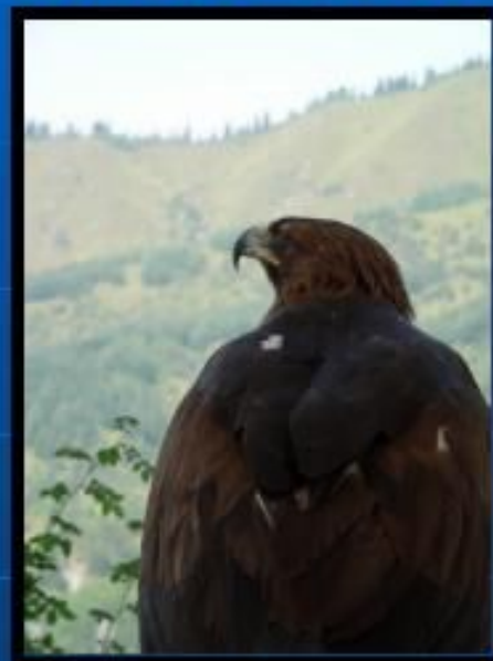
х и щ н и к