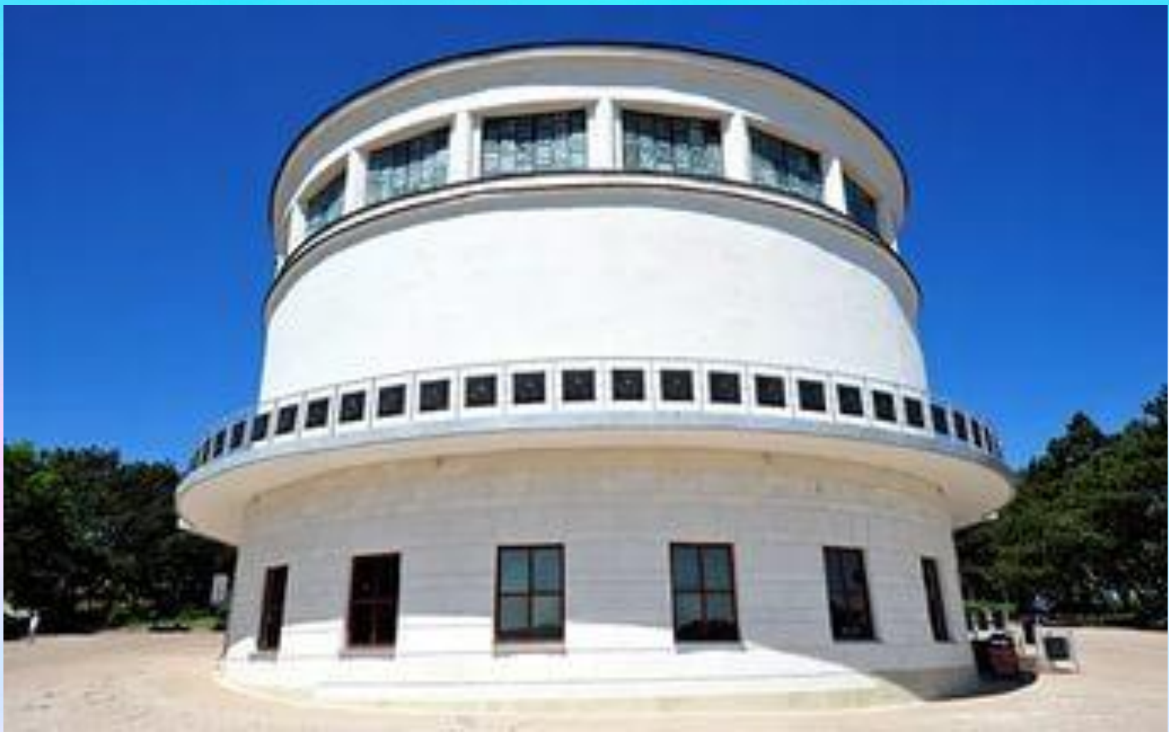
Диорама «Штурм Сапун-горы 7 мая 1944 года»