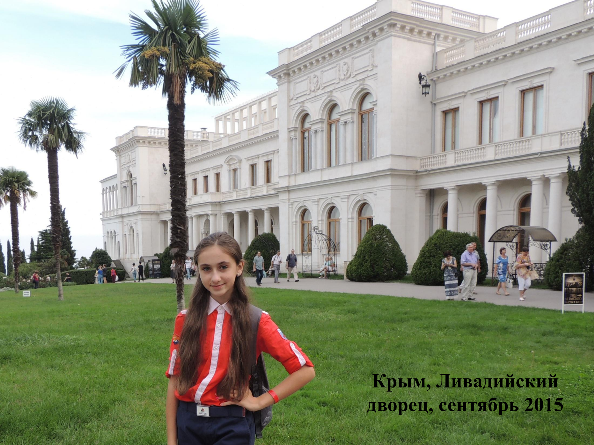
Крым, Ливадийский дворец, сентябрь 2015