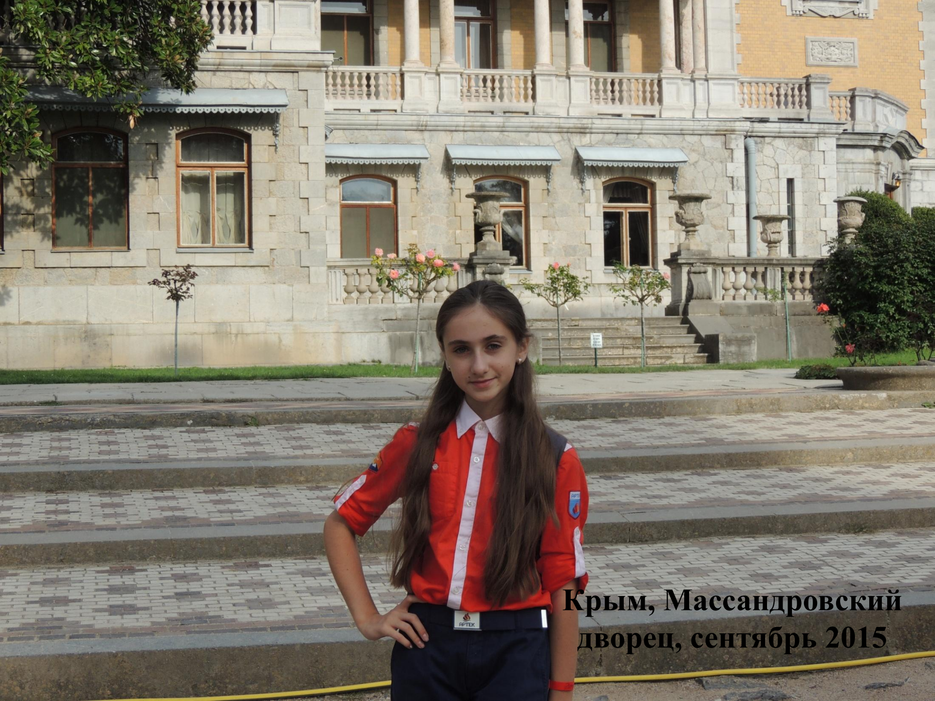
Крым, Массандровский дворец, сентябрь 2015