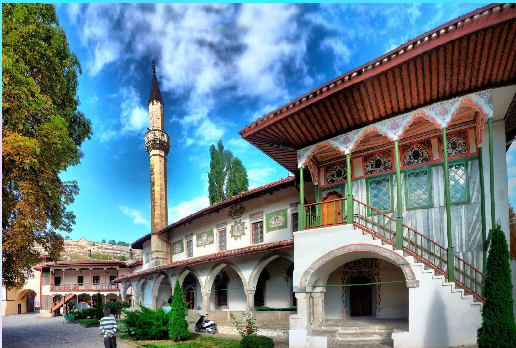
Бахчисарайский ханский дворец