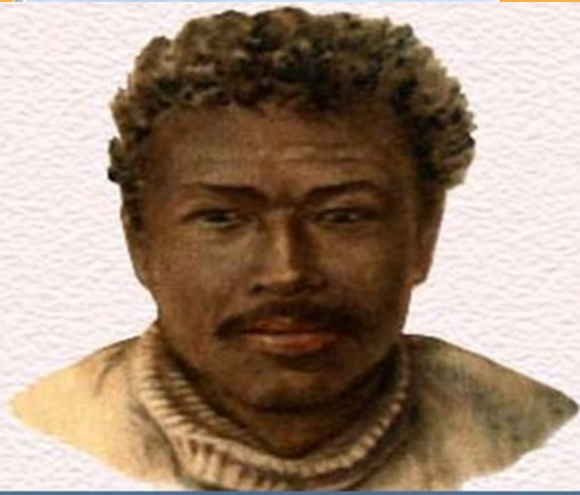
Креолы о. Маврикий. Девушка, исполняющая танец сега.