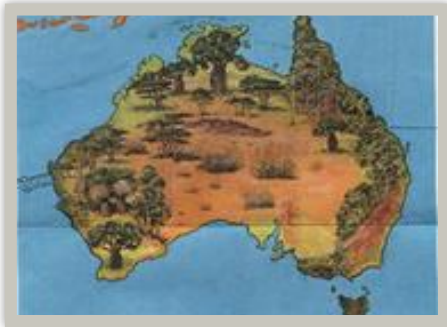
Природные зоны Австралии