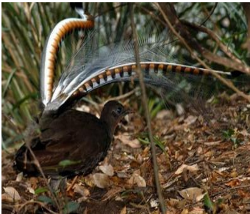
Лирохвост или птицы-лиры