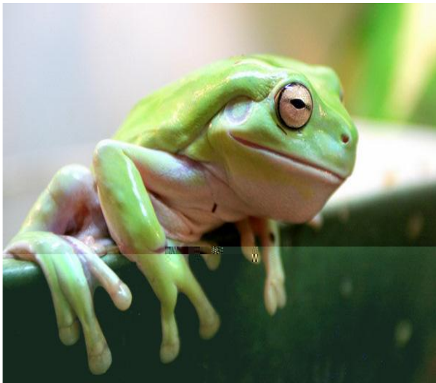
Австралийская голубая квакша

Австралия славится великим изобилием амфибий, особенно лягушек. 93% из 5280 видов лягушек – эндемики. Из них следует отметить семейство австралийских жаб, род австралийских квакш и др.