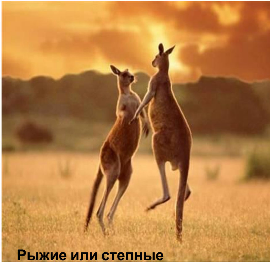
Рыжие или степные кенгуру

Гигантских кенгуру три вида: серые кенгуру, самые большие из всего семейства, рыжие или степные кенгуру, слегка уступают своим серым сородичам в размерах и самые маленькие из исполинских кенгуру — горные.