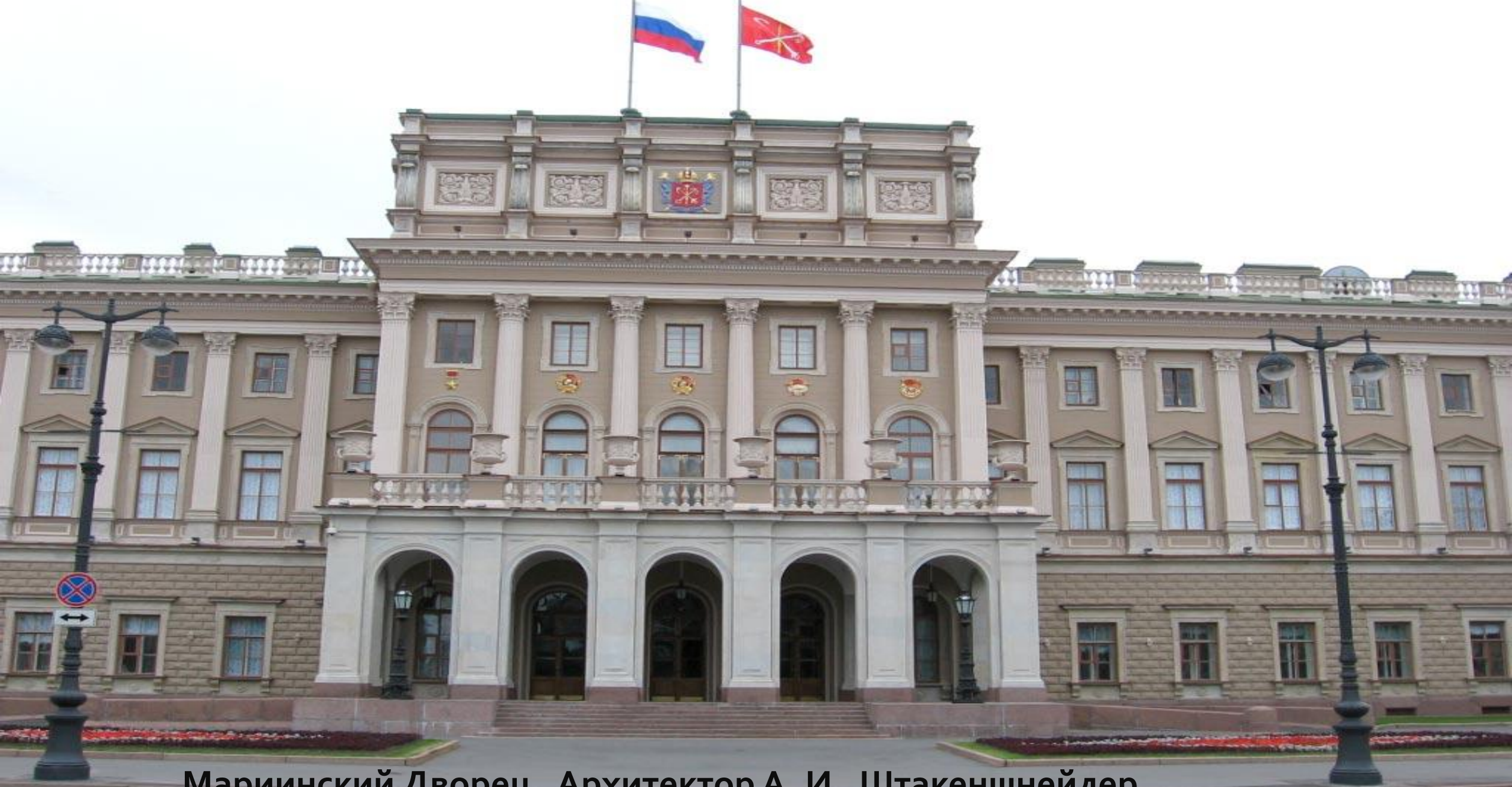
Мариинский Дворец. Архитектор А. И. Штакеншнейдер. Законодательное собрание Санкт-Петербурга