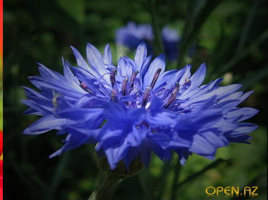
Василе Герман к ия