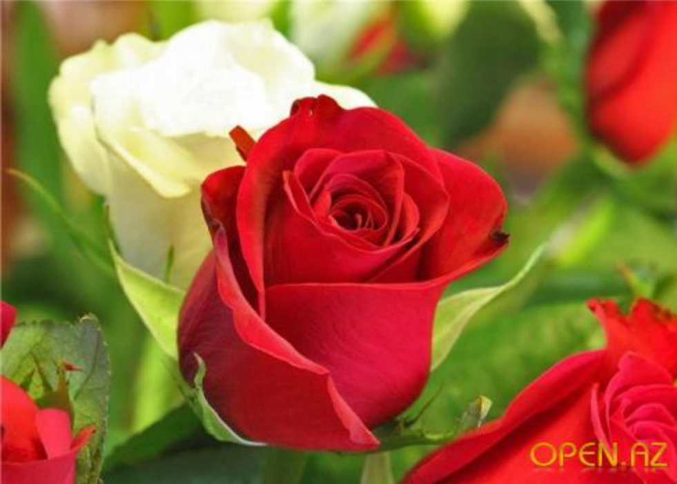
Роз Великобритан а ия