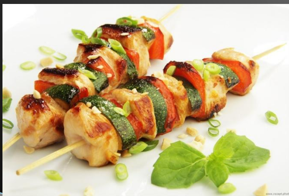
Эшпетада дош маришкош