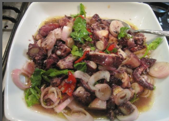
Салата де польво