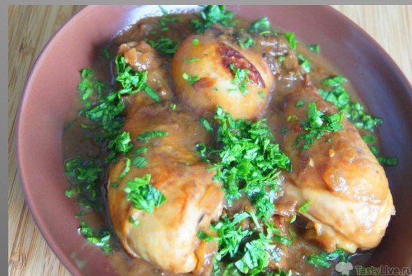
Куриные голени в мозамбикском стиле