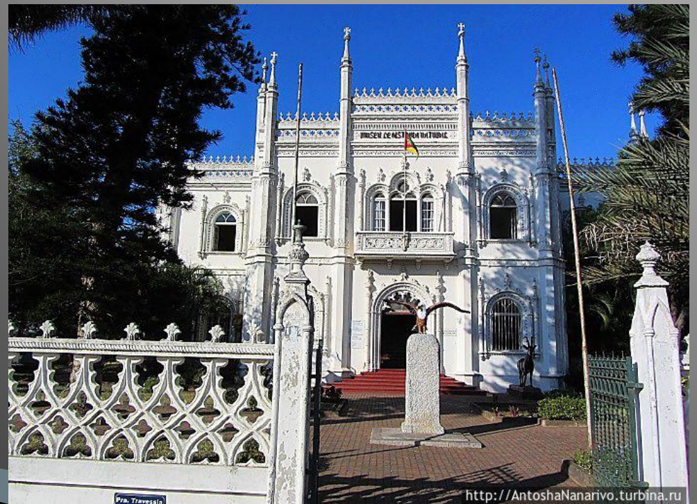
Музей революции, Мапуту