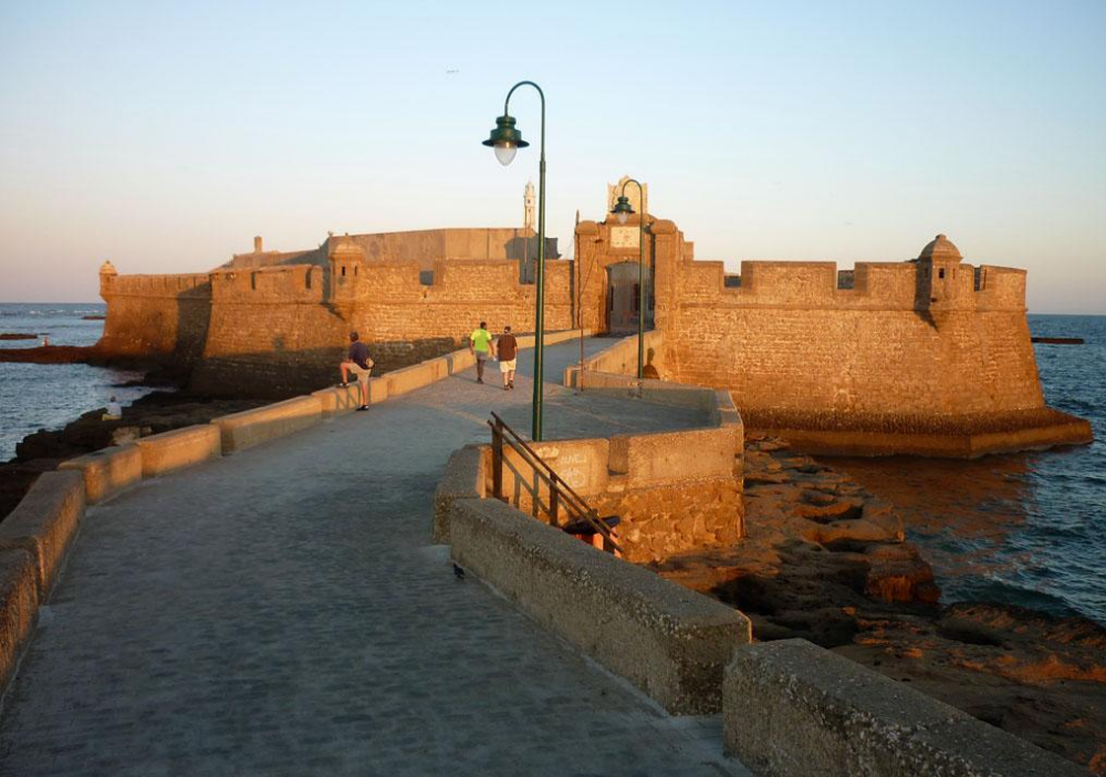
Форт Сан- Себастьян, остров Иль-де-Мозамбик