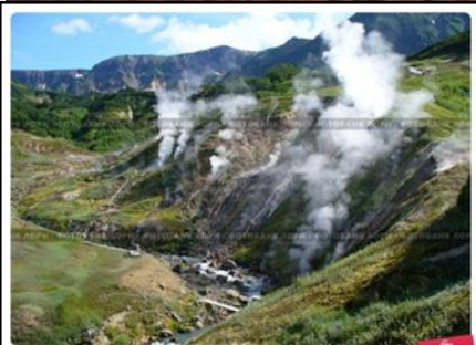
Камчатка, Долина гейзеров