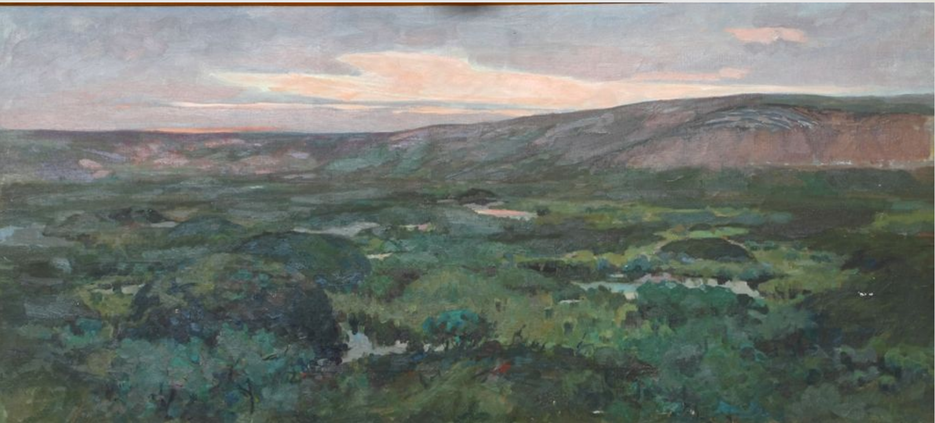
Яков Вундер «Летняя тундра» ➔