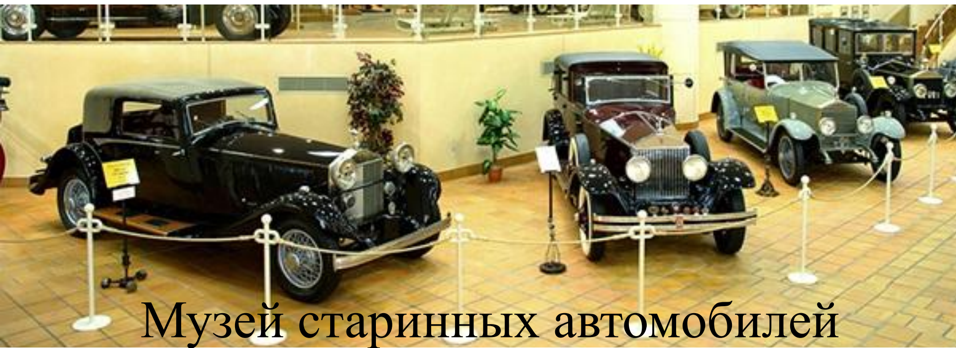
Музей старинных автомобилей принца Ренье Третьего