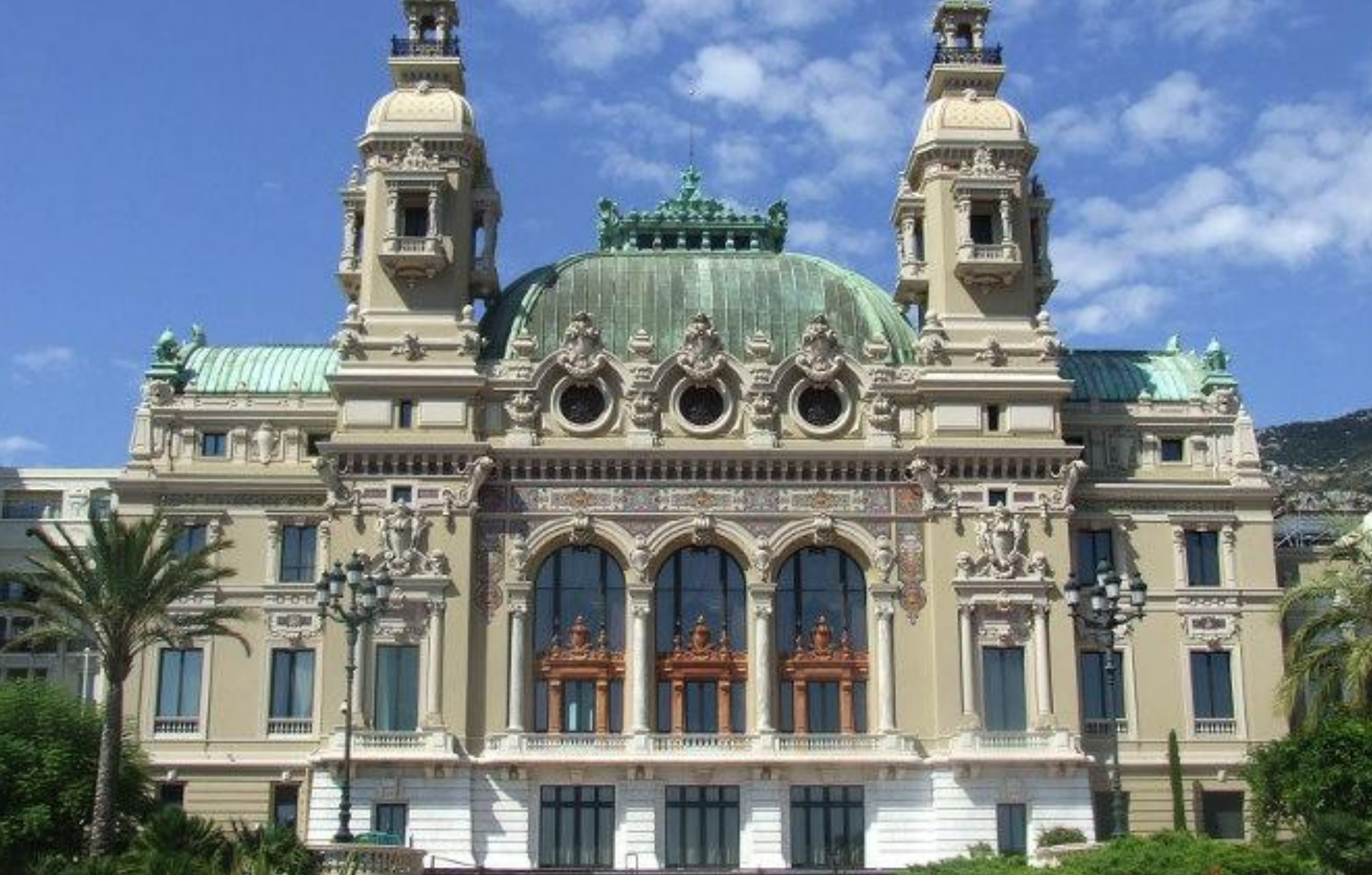
Оперный театр в Монте-Карло