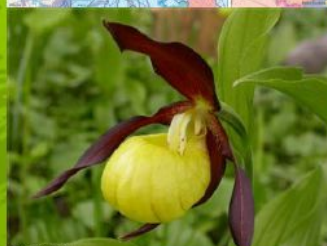
3. Венерин башмачок