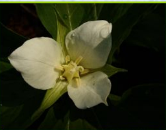
1. Триллиум камчатский