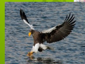
2. Белоплечий орлан