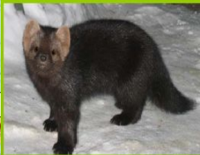
1. Баргузинский соболь