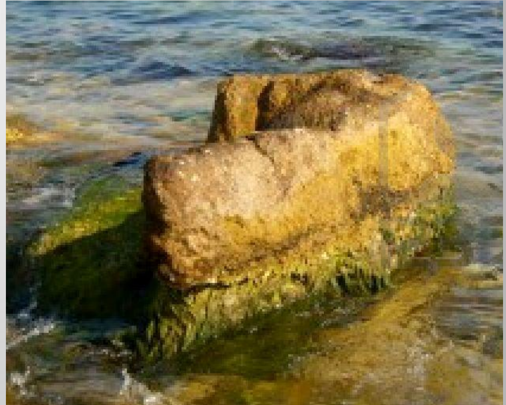
Налет зеленых водорослей