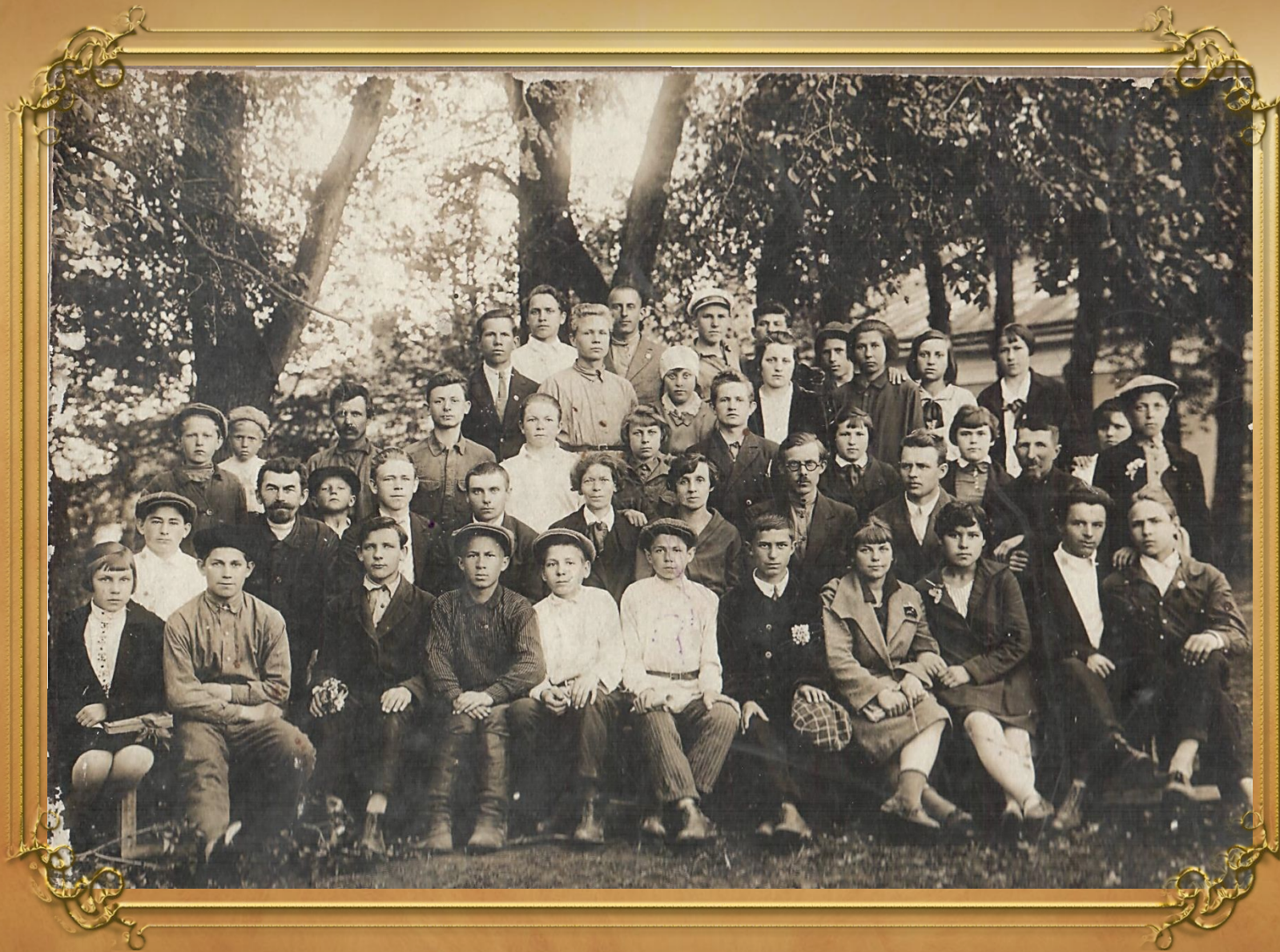
Выпуск 1941 года.