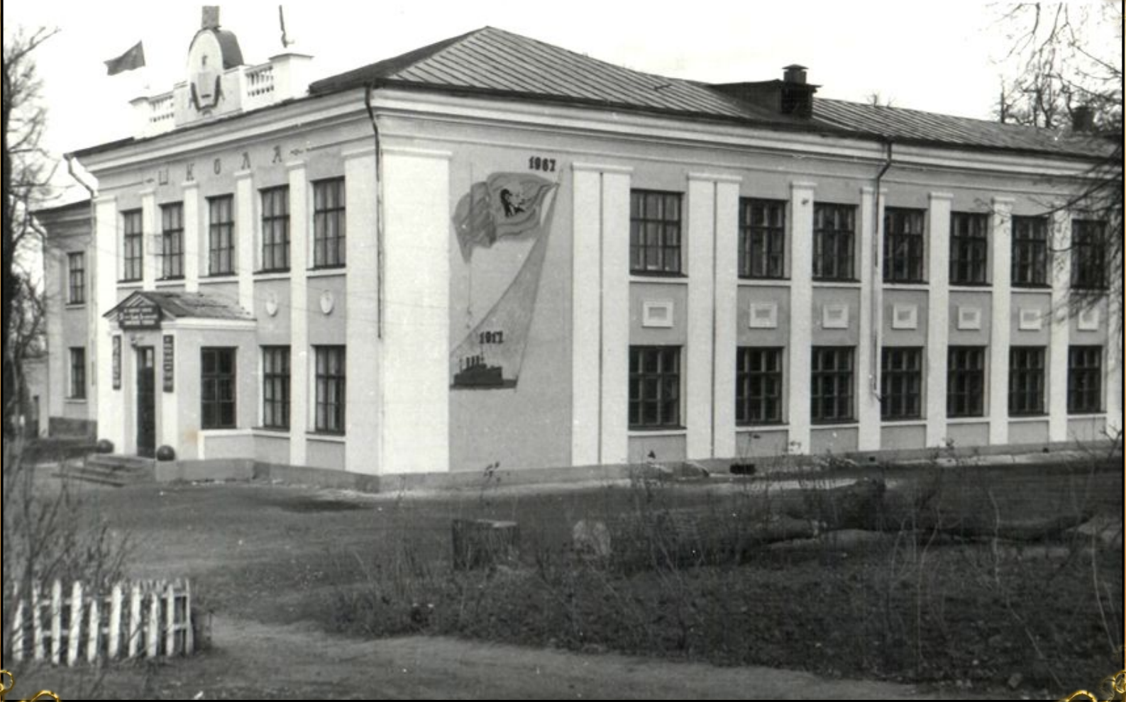
Восстановленная Ивановская школа