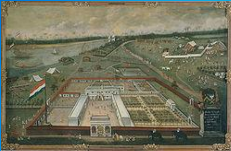
Фактория в Индонезии

Империя быстро расширялась и уже к XVIII веку включала в себя территорию Гвианы , Индонезии , фактории в Индии , на Цейлоне , Формозе и др. За свою историю Нидерландская империя включала множество территорий во многих частях мира. Она имела много соперников, главным из них была Британская империя .