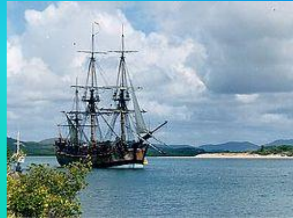
Копия корабля Д. Кука