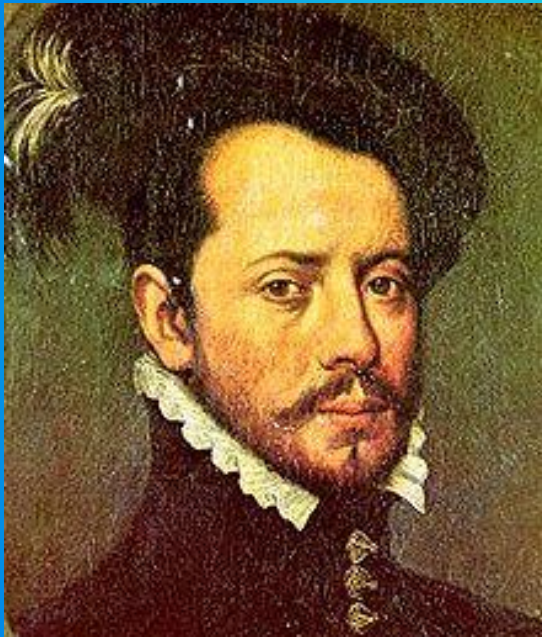
Эрнан Кортес- покоритель ацтеков

❖ Центром колонизации стал остров Эспаньола (Гаити).