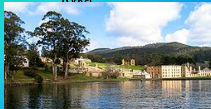
Порт-Артур на Тасмании был крупнейшей пересыльной базой преступников.