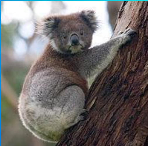
Коала на стволе эвкалипта