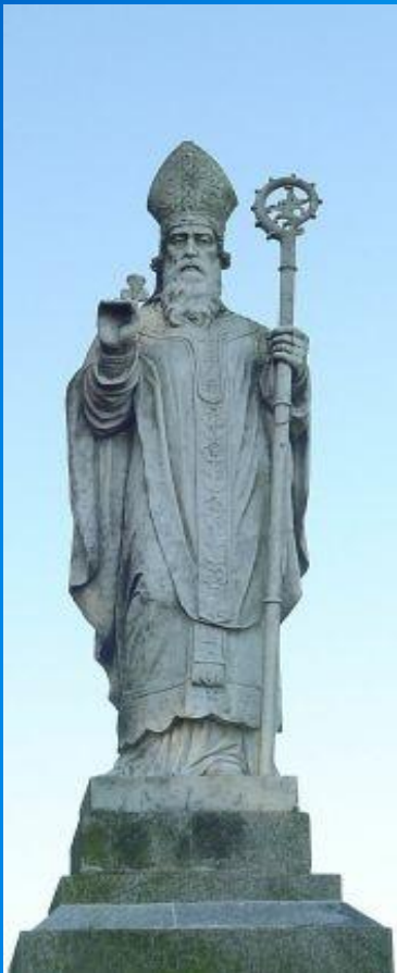
Памятник св. Патрику на холме Тара