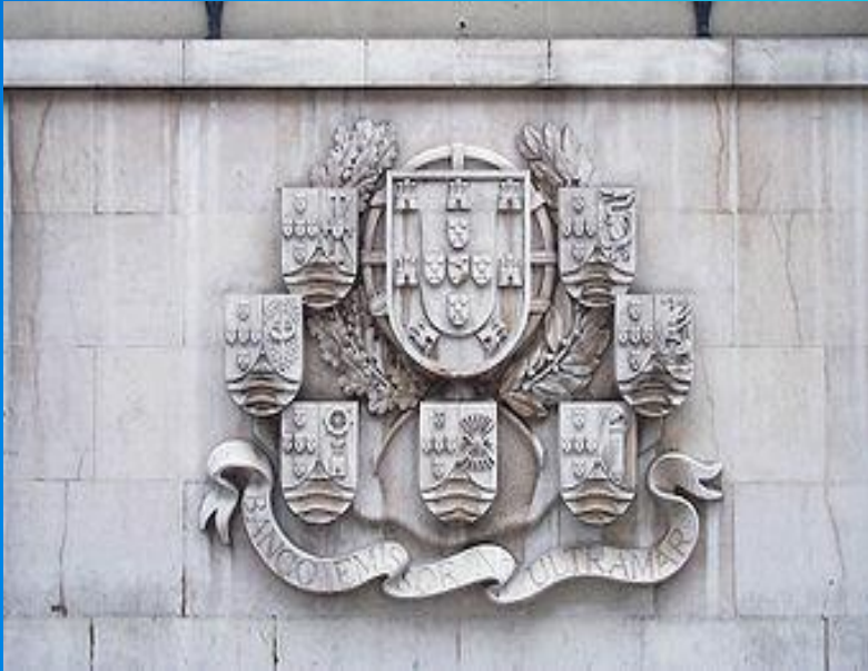
Герб Португалии в окружении гербов колоний

Великие географические открытия конца XV века, активная деятельность португальской знати и торговых элит привели к созданию крупнейшей морской империи нескольких следующих веков.