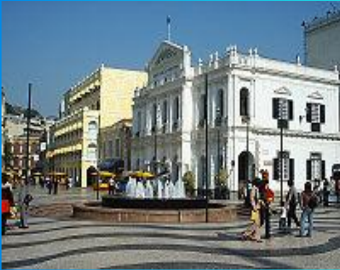
Исторический центр Макао