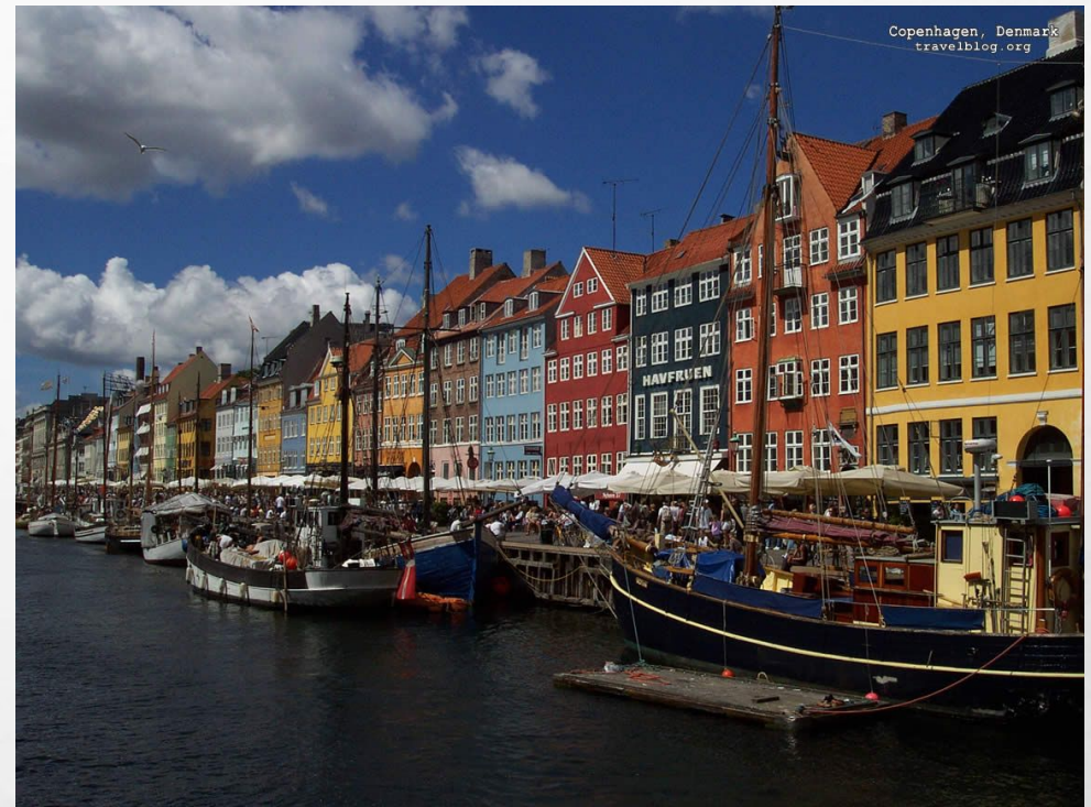
Copenhagen, Denmark travelblog.org