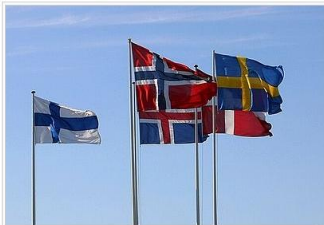
Флаги Финляндии, Исландии, Норвегии, Швеции и Дании