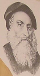
Васко да Гама 1469—1524