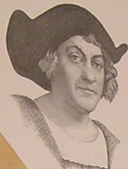
Христофор Колумб 1451—1506