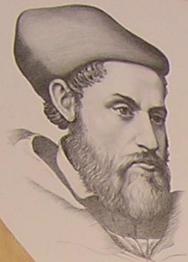
Америго Веспуччи 1454—1512