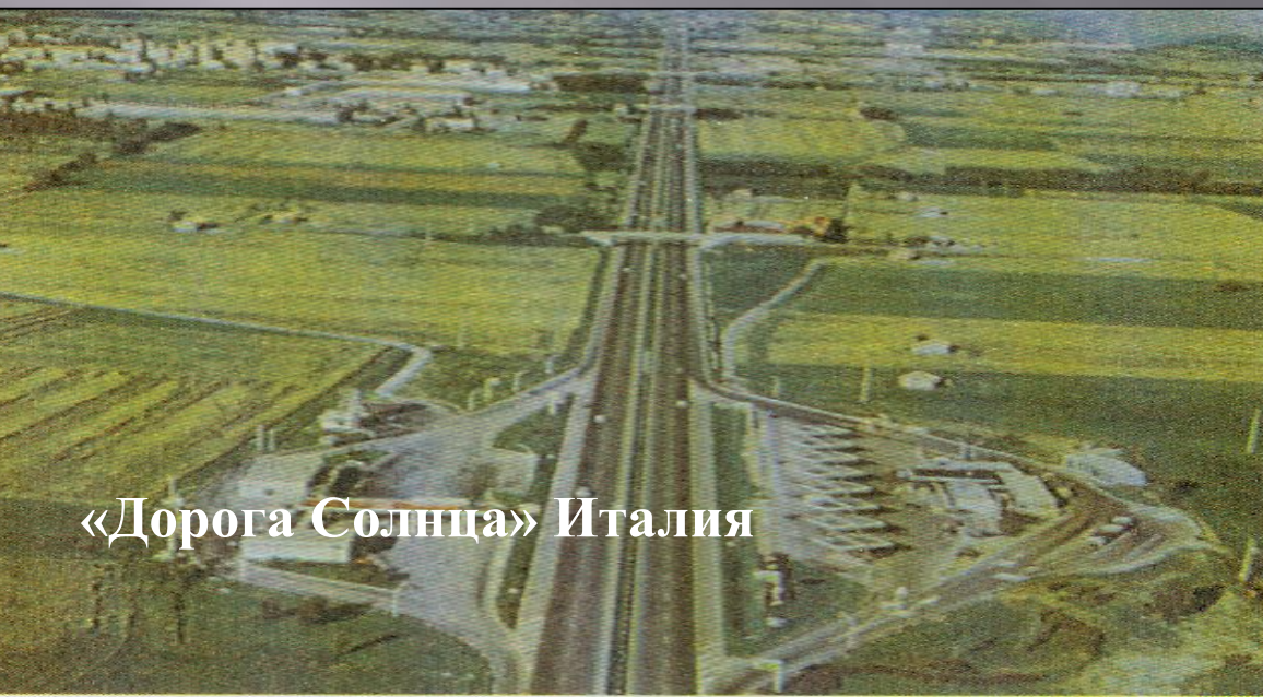
«Дорога Солнца» Италия

По обеспеченности транспортной сетью Европа занимает 1 место в мире.