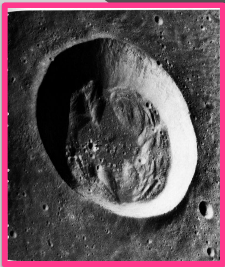
Кратер Бесселя на Луне