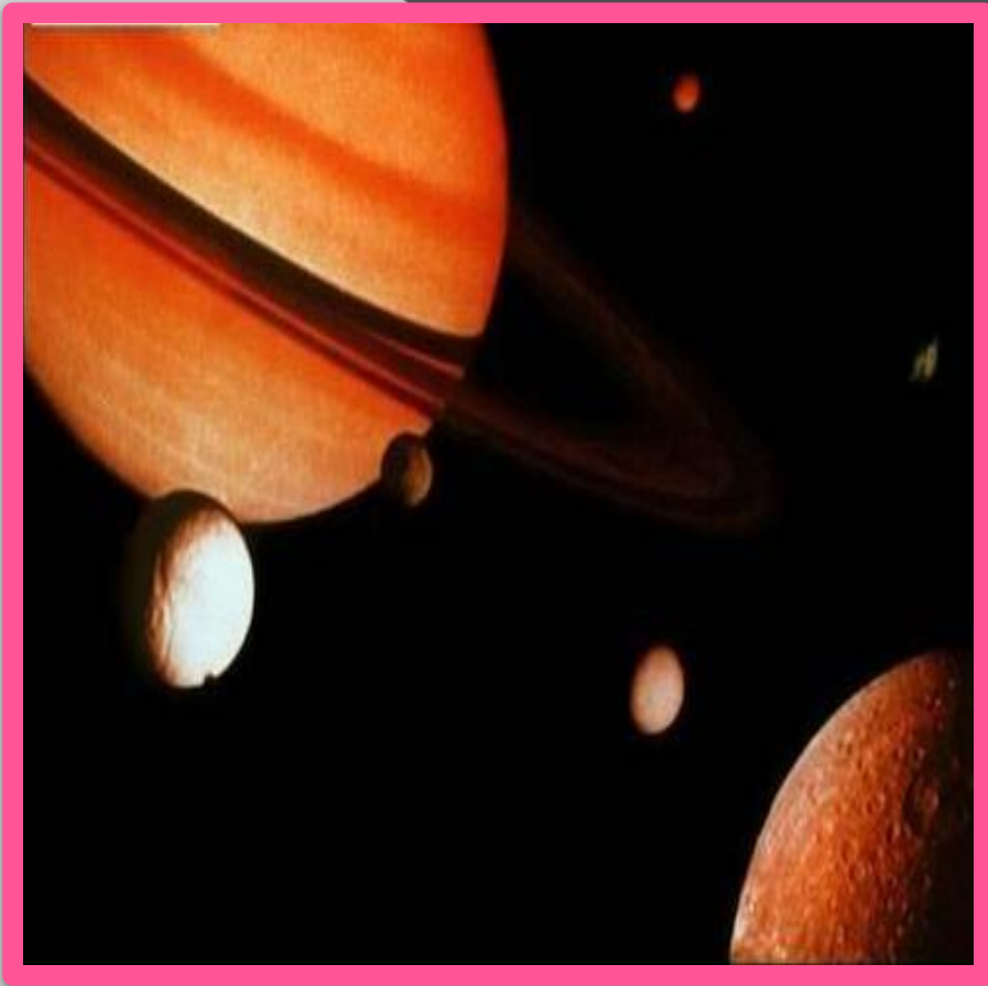
Сатурн и его спутники