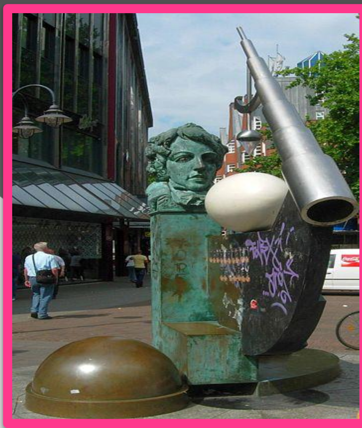
Памятник Бесселю в г. Бремене